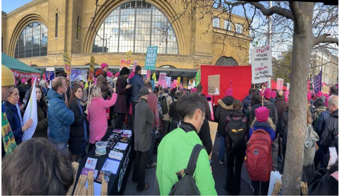
Grevciler hem akademik personelin hem de öğrencilerin haklarını savunuyor, refahta değil savaş harcamalarında kısıtlama yapın, diyor.