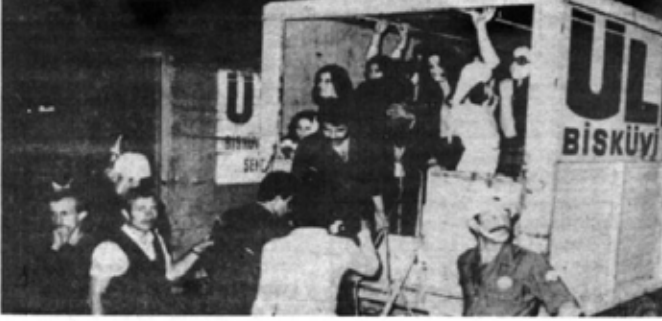
Polis, grevcileri karakola patronun arabasıyla götürdü.

Memlekette işçi sınıfımız işverenlerle, burjuvaziye karşı her alanda mücadelelerini sürdürüyor. Sendikalarda örgütlenen işçiler her türlü baskıya karşı yığıtçe direniyorlar. Grevler her geçen gün hızla artıyor. Sıkıyönetim, baskılar, polis saldırıları işçileri yalduzmayor.