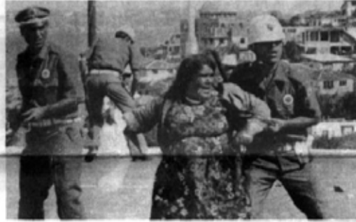
Kış ortasında sokakta kaldı.

dınların üzerine elbirliğe kapıdan kovulmuşken, ligiyle yürüyorlar. 12 Mart faşist biçimi idare bacadan giriyor.