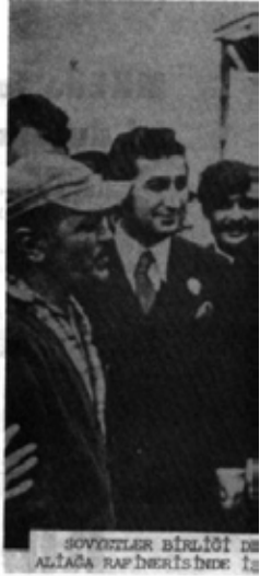
SOVYETLER BİRLİĞİ DE ALIŞA RAHBERİNDE İZ

Ortak düşmana, emperyalizme karşı savaş atmeleri içinde bağlayan bu dostluk, daha sonra barış döneminde de devam etti. 1930'larda Sovyetler Birliği'nin yardımıyla, o zamanlar Orta Doğu'nun en büyük sanayi tesisleri olan Kayseri ve Nazilli dokuma fabrikaları