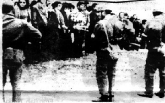
ODTU'DE FAŞİSTLERİN BASKININDAN SONRA GELEN JANDARMALAR VE ÖĞRENCİLER

Emperyalizm ve gericiilik kanlı plânlar peşinde !