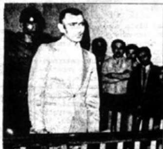
YILMAZ GÜNEY, ÇİLESI BİRESDİ

Bu oyunu bozmak, tertiplerin iğyüzünü açığa vurmak devrimimizdir.