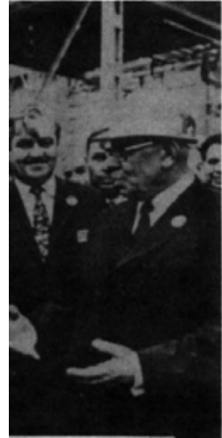
T BAŞKANI PODGORNI VE MÜHENDİSLERİNİZLE

si yolda 3 milyon ton ham petrol, dizel, kaynak ve jet yakıtı, gazyağı, benzin, sıvı gaz çıkaracak.