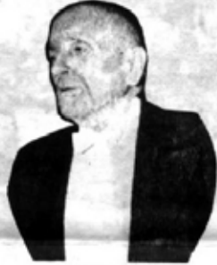
YUSUF KEMAL BEY

Yusuf Kemal Bey hatıralarında bu yardım üzerine şunlara söylüyor: "Ruslar, Türkiye'nin kalkınması için müteaddit senelerde on milyon altın ruble vermeyi taahhüt ettiler. İlk kasma olan 500 bin altın ruble 100 binini, Almanya'dan uçak, vesaire almak için atamamışlar Saffet Arıkan'a bıraktılar. 400 bin altın ruble trenle Kars'a ben getirdim. Ruslar, daha önce de bize iki defa para göndermişlerdi. Hatta bir seferinde yardım getiren bir takımı, bir gün gilis torpidosu durdurmuştu. Fakat altınlar, takanın taban