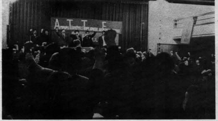
EMPERYALİZME, FAŞİZME VE HER TÜRLÜ GERİCİLİĞE KARŞI TEK VÜCUT - TEK YUMRUK