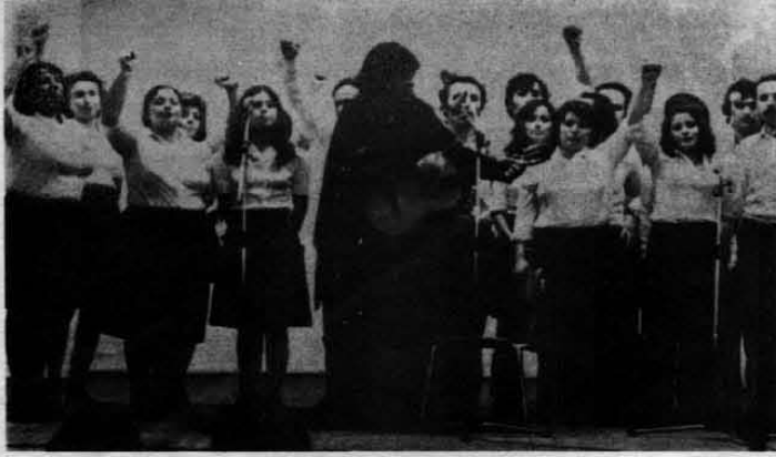
ATFF İŞÇİ KOROSU VE ŞİLİLİ OZAN: VENCEREMOSI KAZANACAĞIZ!