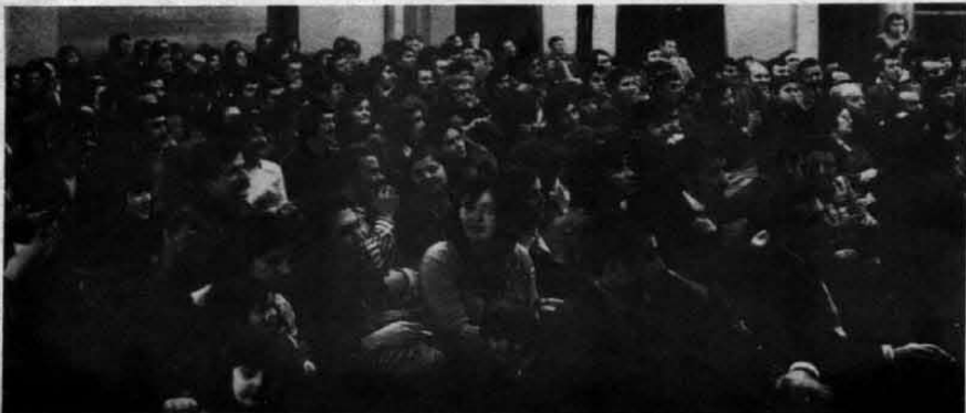
ATFF İŞÇİ KOROSU KONSERLERİ BÜYÜK İLGİ TOPLADI

7. ATFF Kurultayı, Türkiye işçi sınıfının ayrılmaz bir parçası olan Avrupa'daki devrimci hareketimizde bir dönüm noktası oldu. Kurultay'a katılan herkesin mücadele azmi daha bir bilindi.