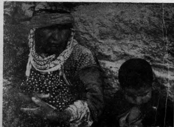
KADINLARIMIZ - BU ÇİLE BİR GÜN BİTECEK MUHAKKAK

1975 dünya kadınlar yılı, yurdumuz kadınlarına ve hepimize kutlu olsun! Mücadele ve başarı yalı olsun!