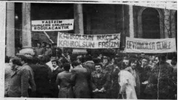
İSTANBUL 22 ARALIK 1974 - "FAŞİZM GEÇEMEZ"

Fransa'da çalısan Türkiye'li işçiler sendikaların önderliğinde birleşerek haklarına arıyorlar. Yeni haklar