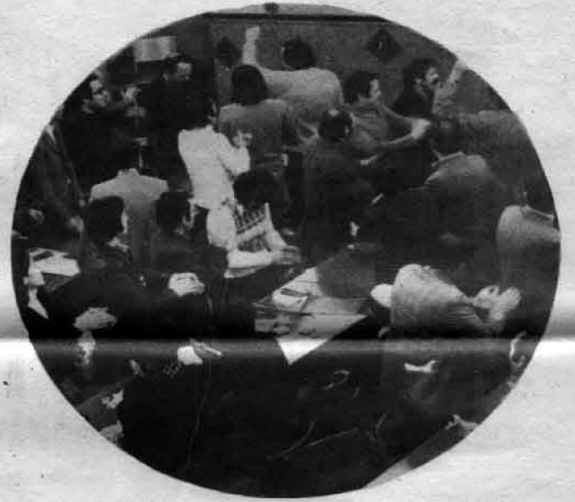
BARİŞ, DEMOKRASİ, SOSYALİZM YOLUNDA İLERİ!

Maoculuğun, Troçkiciliğin, Anarşizmin, MDD'ciliğin, Kavalcılığın, ülkemizde iş