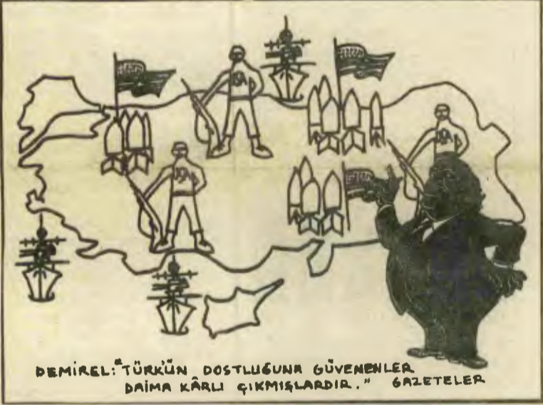
DEMİREL: "TÜRKÜN DOSTLUĞUNA GÜVENENLER DAİMA KARLI ÇIKMIŞLARDIR." GAZETELER