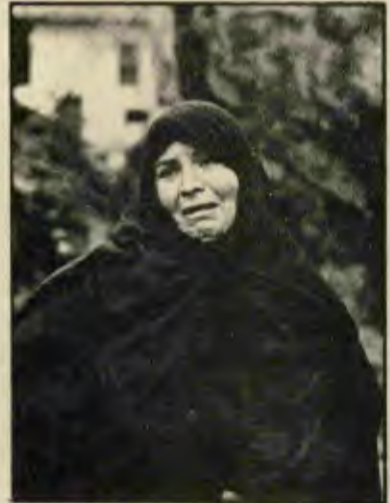
BUGÜN AĞLIYOR, AMA YARIN GÜLECEK; BUGÜN ONU AĞLATANLAR DA, DÜZENLERİ DE ALAŞAĞI EDİLECEK.

"20 yılda emeklilik" adı altında çıkartmaya çalıştık-