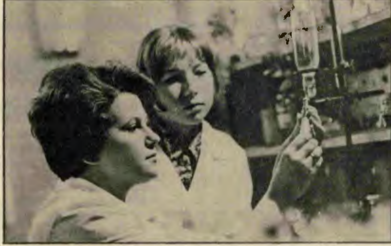
KADIN, HAKKETTİĞİ YERİ GERÇEK EŞİTLİĞİ ANCAK SOSYALİST TOPLUM DÜZENİNDE ELDE EDEBİLİYOR. İŞTE, YUKARIDAKİ RESİMDE, MOLDAVYA SOVYET SOSYALİST CUMHURİYETİNDE BİR BESİN ARAŞTIRMA ENSTİTÜSÜNDE ÇALIŞAN İKİ KADIN BİLİMCİ...

yapan, ona toplumda lâyak olduğu yeri veren sosyalist düzen kadınların kurtuluşunun nerede olduğunu bir kez daha açıkça gözler önüne seriyor.