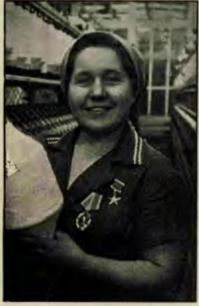
SOVYETLER BİRLİĞİ'NDEN SOSYALİST EMEK KAHRAMANI BİR KADIN TEKSTİL İŞÇİSİ.

Öte yandan, sosyalist toplumda ise kadınların durumu bambaşkadır. Sosyalist toplum sömürünün ortadan kalktığı, üretimin, karşılıklı dayanışma ve yardımlaşma ilişkileri temelinde düzenlendiği bir toplumdur. Devlet, işçi sınıfının ve tüm emekçilerin devletidir.