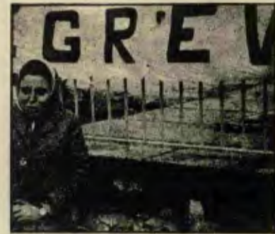
ARTIK SUSMUYOR, "KADER" DEYİP BOYUN EĞMİYOR...

mevki olabilecekler ne de daha fazla para alacaklar. Tam tersine emeklilik ücretlerinde %10'luk bir düşme olacak.