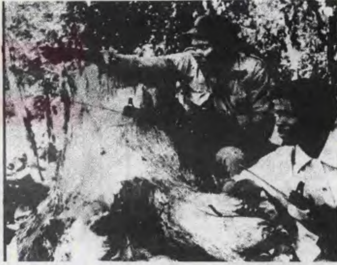
ZİMBABVE SINIRINDA MOZAMBİK-Lİ ASKERLER (üstte) ve SAMORA MACHEL (altta)

Mozambik Kurtuluş Cephesi'nin 3. kongresine 23 komünist partisi ve 6 ulusal kuruluş hareketi delegasyonu katılmıştır. Çin Komünist Partisi ise çağrılmamıştır. Sovyet delegesi Başkan Machel'e üzerinde Lenin'in bir resmi bulunan büyük bir kırmızı bayrak, Alman Sosyalist Birlik Partisi delegesi de Marks'ın bir büstünü hediye