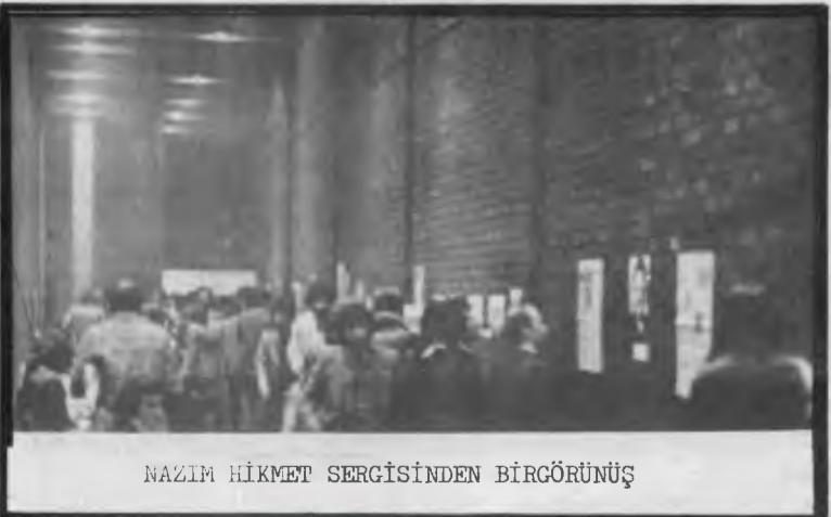
NAZIM HİKMET SERGİSİNDEN BİRGÖRÜNÜŞ