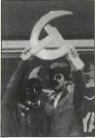
"Adı ve eserleri" Türkiyeli komünistlerin savaşlarında da yaşayacaktır.