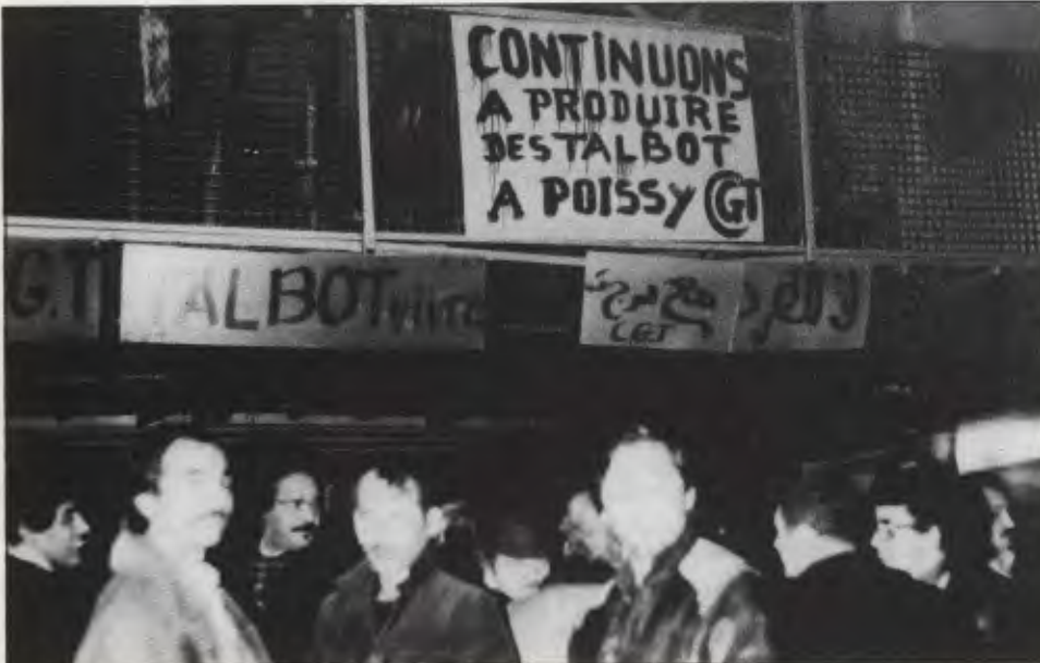
Talbot işçileri grev yerinde

Grevinizin birlik içinde sürmesini dileriz. Başaracağınıza inanıyoruz.