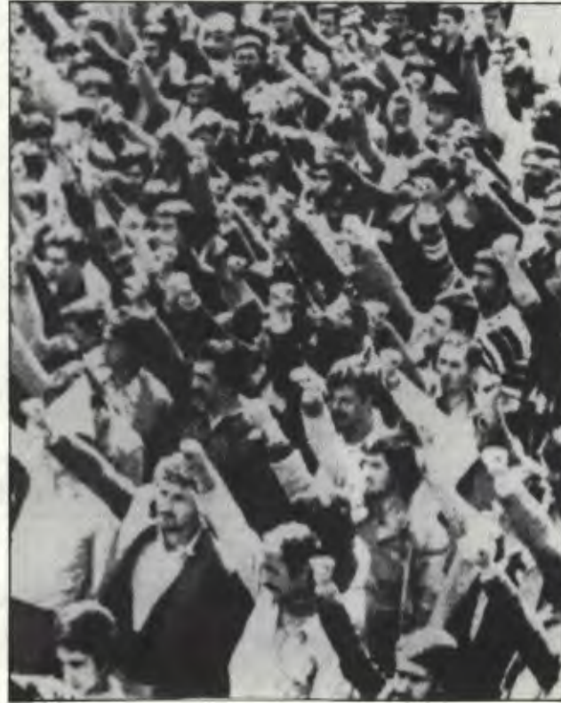
Türkiye işçi sınıfı yumruklarını sıkıymıştır. Sendikal savaşım artık durdurulamaz.

Tunç, Anayasa'yı, "işçi gerçeğini böylesine görmemezlikten gelmekle", "demokrasiyi demokrasi yapan evrensel ilkeleri böylesine çiğnemekle", "sorumsuz işveren yaklaşımını böylesine kurumsallaştırmakla" suçladı. Sanki Anayasa çıkarırken Türk-İş uzaydaydı! Anlaşıyor ki Türk-İş tabanı Anayasa'ya tutumun hesabını soruyor.