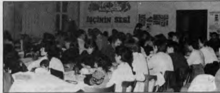
Gecenin kalabalıklığı dayanışmanın boyutlarını yansıttı.

kasyonlarla açığını kapatmaya çalışıyor. Buna karşı tüm Türkiyeli, yabancı ve Alman demokratik kişi ve kuruluşlar daha güçlü bir sesle yanıt vermezlerse, burjuvalığıyla zaten sınırlı demokrasiyi biraz daha sınırlama yönünde adımlar atılacak-