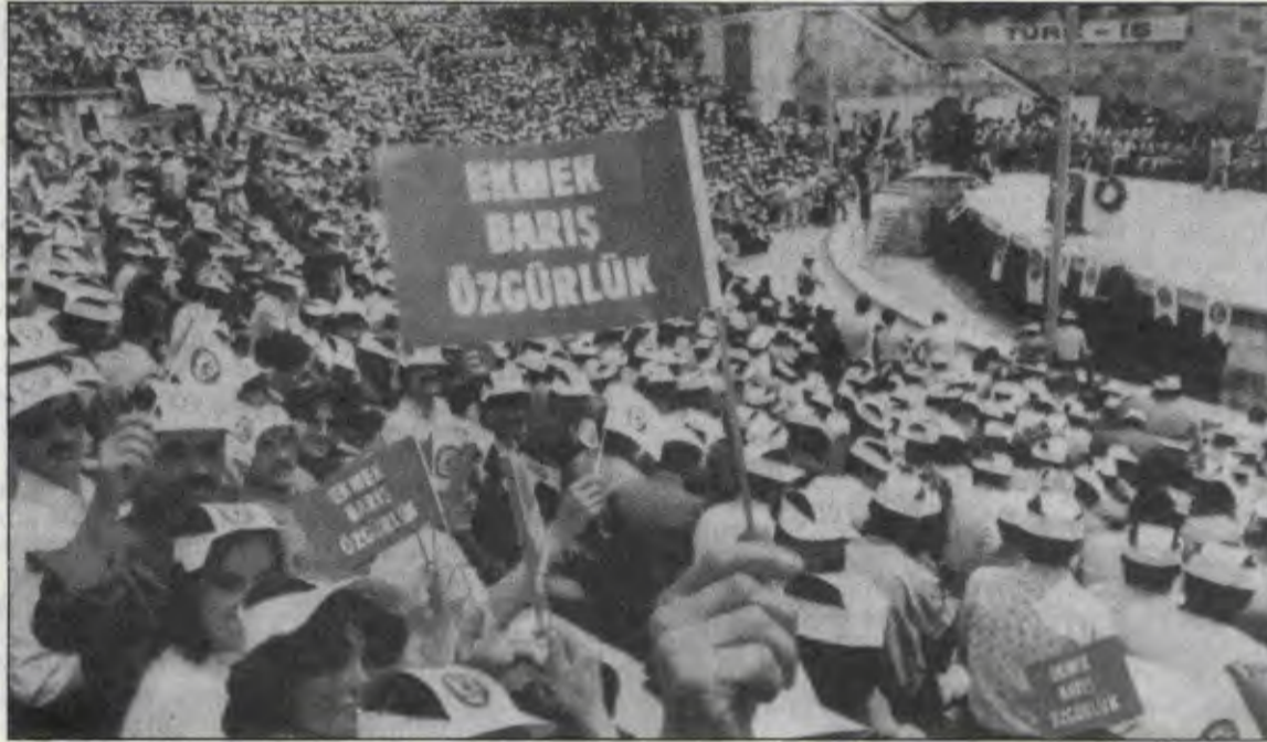
Türk-İş Birinci Bölge Temsilciliğinin İstanbul'da düzenlediği "geniş tabanlı hak arama" toplantısından bir görüntü

kin kasan Evren, af konusunda Avrupa demokratik kamuoyuna "yanıt" vermeye çalışırken, Avrupa'dan, Hitler'in sağ kolu faşist Hess'in neden affedilmediğinin hesabını sordu! Avrupalılar faşistlere karşılırsa biz de komünistlere karşıyız demeye gelen bir mantık yürüterek faşist kimliğini bir güzel sergiledi.