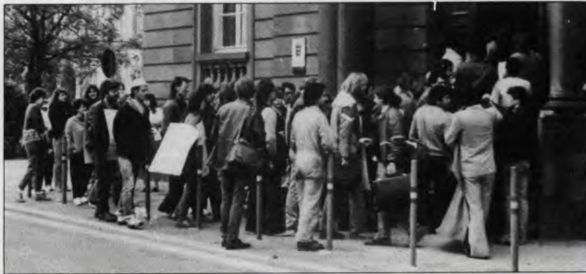
Yoldaşlarımız tutuklanırken biz de olayı protesto ettik.

4. Yoldaşlarımızın haklılığını kanıtlamak ve gerici basının etkisi altında kalanlara olayın hiç de örneğin Mannheimer Morgen 'in yazdığı gibi olmadığını göstermek için bir sergileme gerekiyordu.