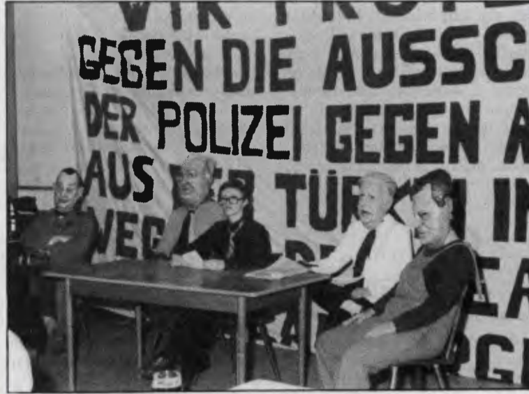
Düzenlediğimiz gecede, Rote Rohr tiyatrosunun gösterisi