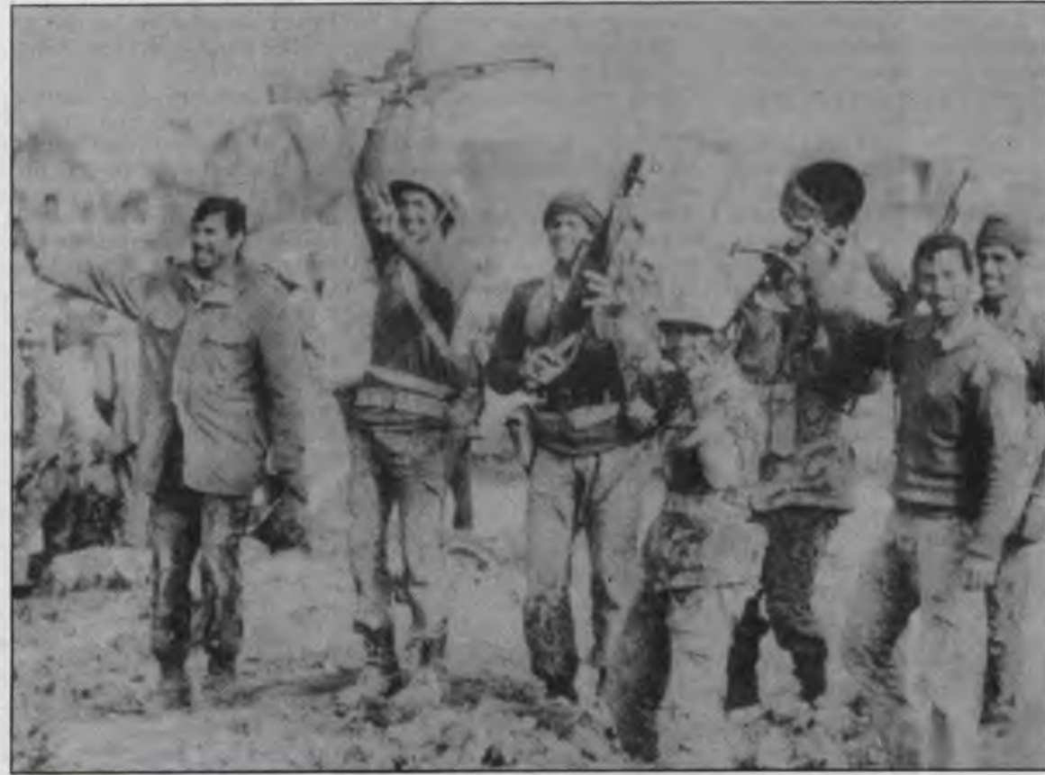
Irak askerleri bir başarıyı kutlarken... Oysa savaş burjuvaların çıkarları için veriliyor. Askerler neyi kutluyorlar?

1978-1982 arasında Suudi Arabistan "Üçüncü Dünya" ülkelerine ihraç edilen büyük silahların tümünün %8,2'sini ithal etti. Irak %5,2'yle, İran %3,5'le