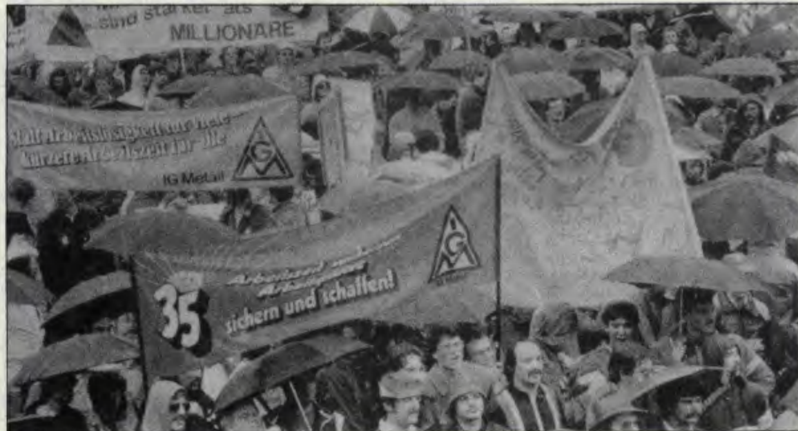
Bonn'da yapılan 200 bin kişilik yürüyüşten bir görüntü

Grevdeki işçilerden 27.000'ine karşı lokavt ilan edildi. Hessen evaletinde iş mahkemesi lokavtun