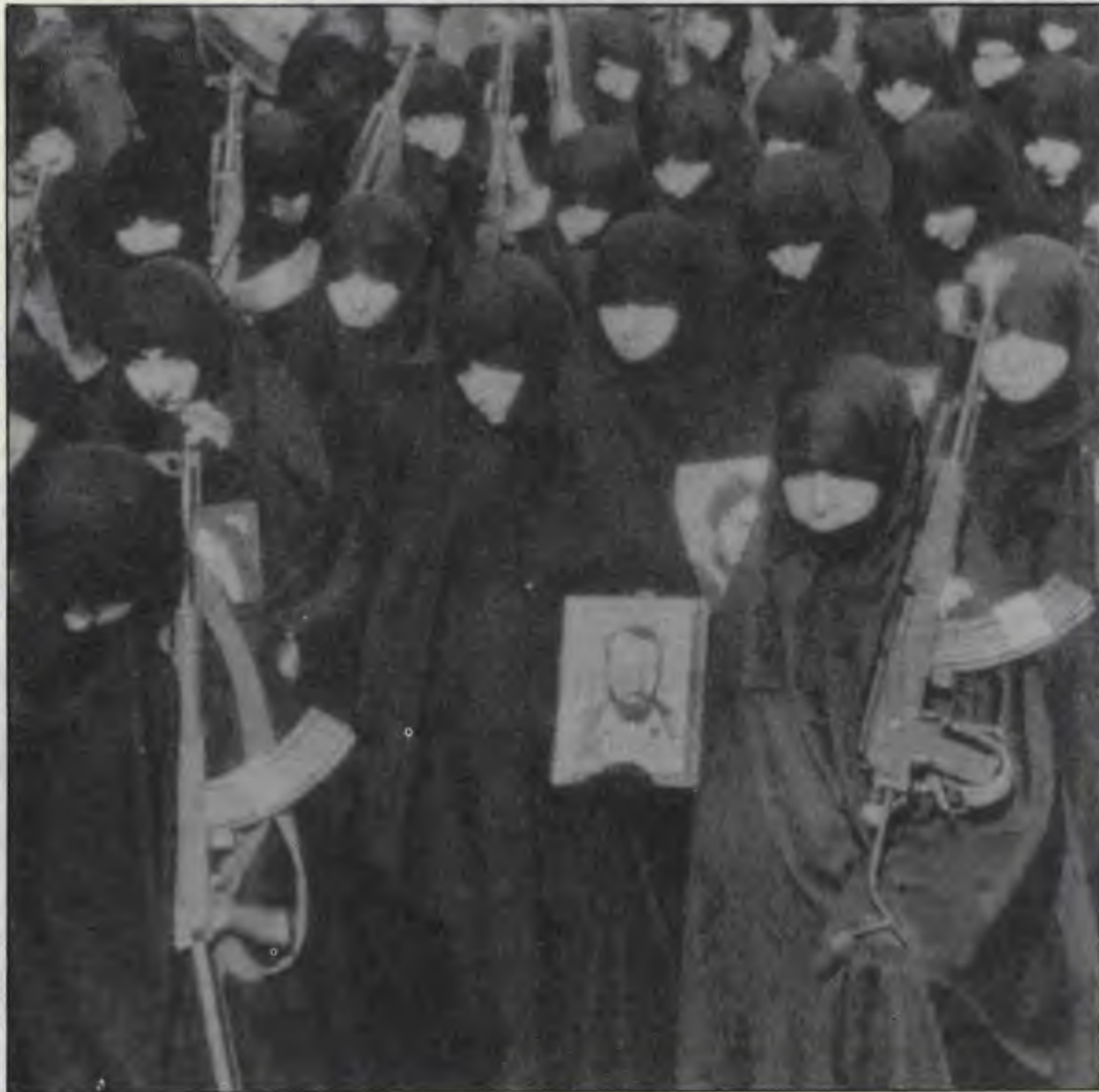
İranlı kadınlar silah altında... Çarşaflarının çelişkili bir görünümü var.

258. sayımızda çıkan "İran Irak savaşı üstüne" başlıklı yazıda bir yapıtma yanlışımı oldu. 14. sayfadaki son iki paragrafın 15. sayfadaki ilk sütunun dördüncü ve beşinci paragrafları arasında olması gerekirdi. Düzeltir, özür dileriz.