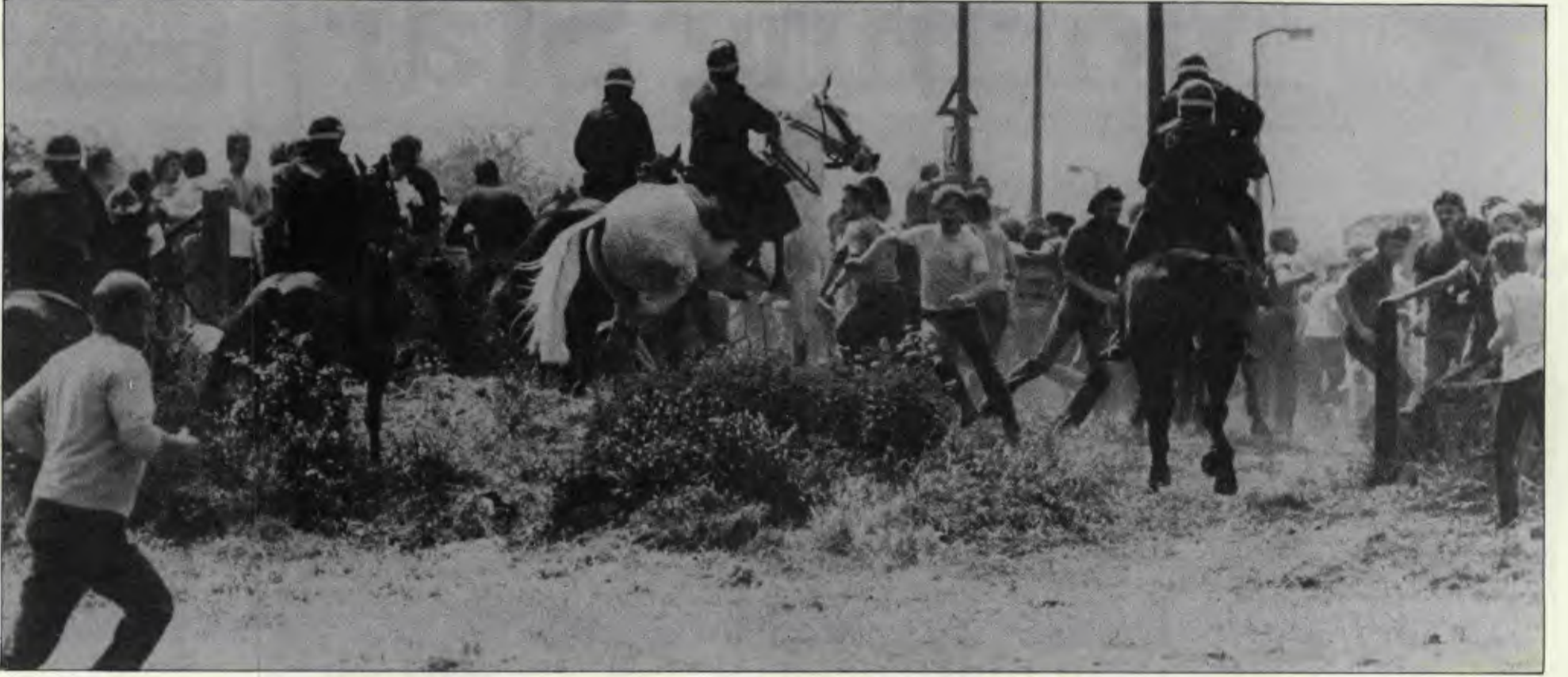
Madenciler grevi İngiltere'de yıllardır görülmedik bir kararlılıkla sürüyor

Grev, işçi hareketinin geleceği üstüne ciddi bir sınav niteliği kazandı. Maden işçileri kararlılıkla savaşıyorlar. Bu kararlılığı sürdürürlerse her türlü engeli aşip sınıflarına da büyük adım attıracaklardır.