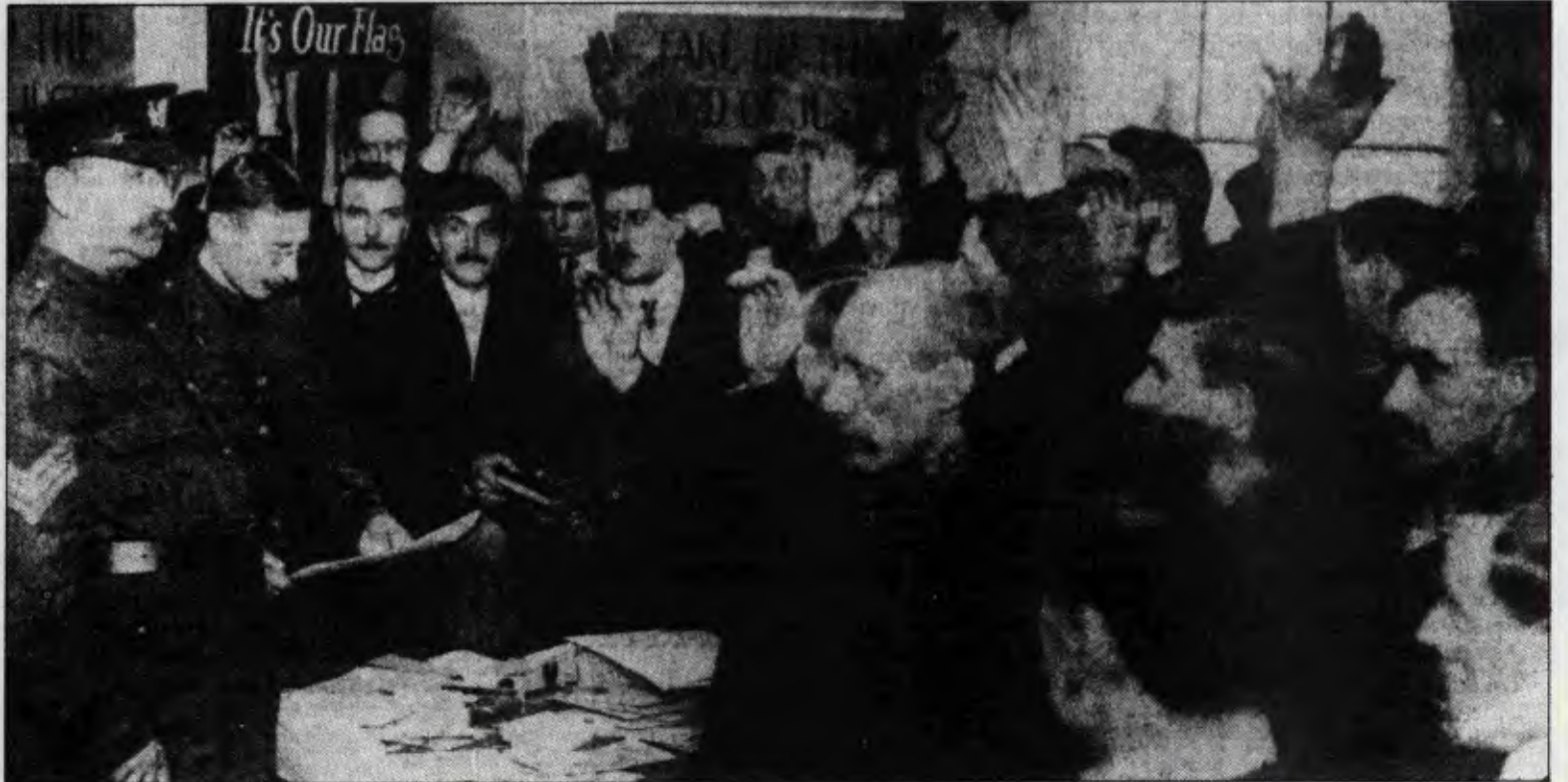
1. Dünya Savaşı'nda milyonlarca emekçi emperyalist burjuvazinin dünyayı yeniden paylaşımı uğruna can verdi.

1. Dünya Savaşı'nın 70. yıldönümünü anarken, Batı'nın en büyük tarihçileri bile savaşın özünü açıklayamıyorlar. Savaş ülkelerin farklı bloklar oluşturmalarına bağlayanlar var. Büyük Ekim Devrimi savaşın sonunda doğduğu için, bu devrimin de Avrupa'nın ürünü olduğunu iddia edenler var. Avrupa çapında bir savaşın Dünya Savaşı adını taşımasıyla övünenler ve