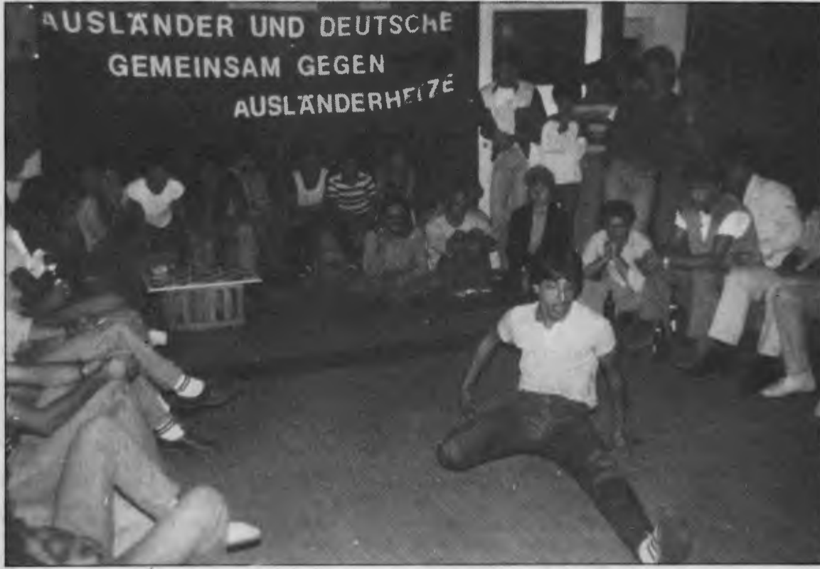
Gençlik eyleminden bir görüntü

Açılış konuşmasını yapan arkadaşımız eğlencenin anlamını anlattı. Gençlik evinin sorumlusu Alman arkadaş da bir konuşma yaparak, bu günün önemini anlattı ve Alman arkadaşların da bizimle dayanışma içinde olduğunu belirterek, bu tür eğlencelerin ileride daha sık yapılmasını diledi. Daha sonra folklor oynanıp, saz çalındı. Ayrıca gençler yabancı düşmanlığına karşı break-dans yarışması yaptı. Elma ve yoğurt