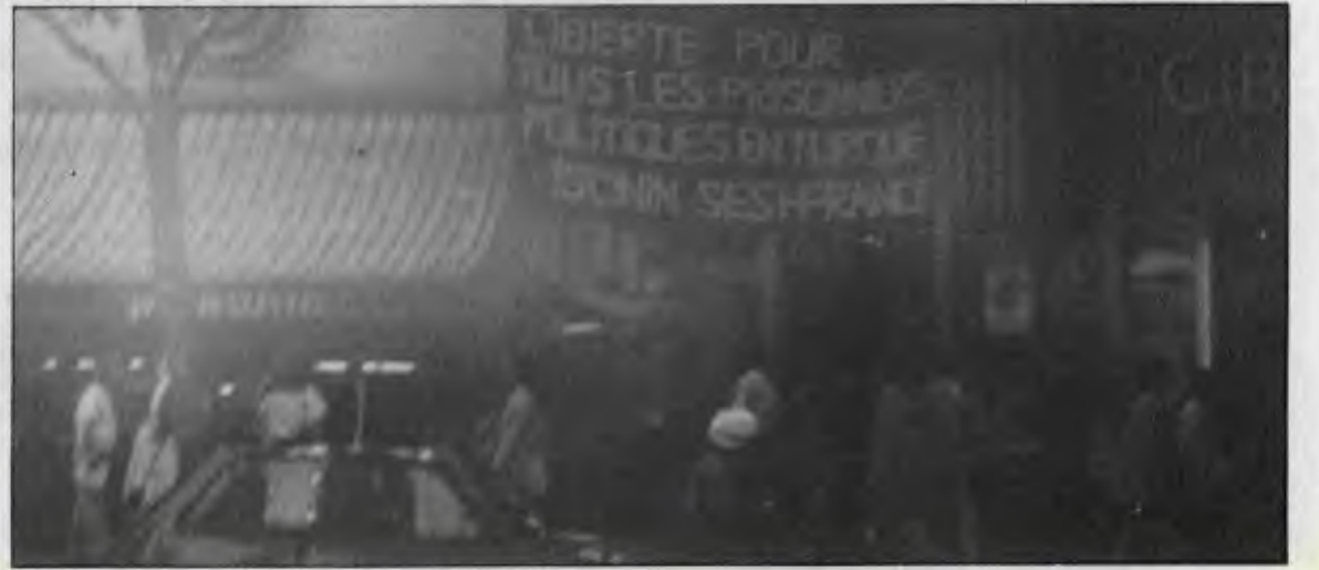
Kalabalık bir semte astığımız pankart büyük ilgi topladı.