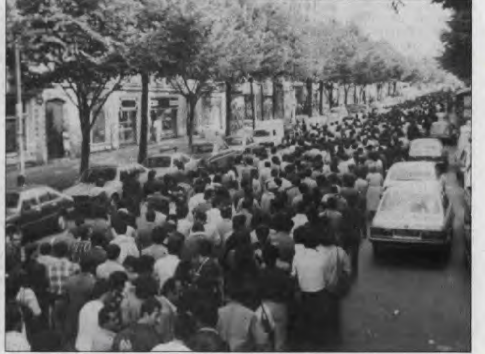
Yılmaz Güney'in cenazesine binlerce insan katıldı. Güney yığınsal bir törenle uğurlandı.

Değerli Yoldaşlar, Dokuz Eylül sabahı erken saatlerde yitirdiğimiz büyük halk sanatçısı Yılmaz Güney'i 13 Eylül perşembe günü yığınsal bir törenle toprağa verdik.