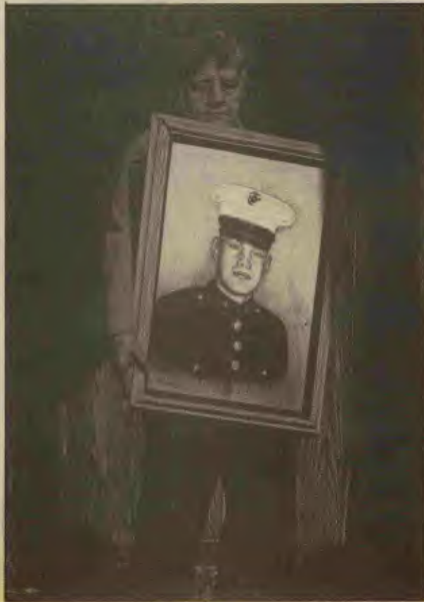
Emperyalizm Vietnam'da yalnızca Vietnam halkına değil ABD halkına da acı ve yıkım getirdi. Savaşta ölen ABD askerleri 58 bin, savaş sonrasında 10 yıl içinde intihar eden eski askerlerin sayısı ise 100 bindir.

kişilik bir tim de kuleye saldırdı. 11 Fransız ve yerli satılmış asker bertaraf edildi. 8 tüfek ve 20 el bombası ele geçirildi.