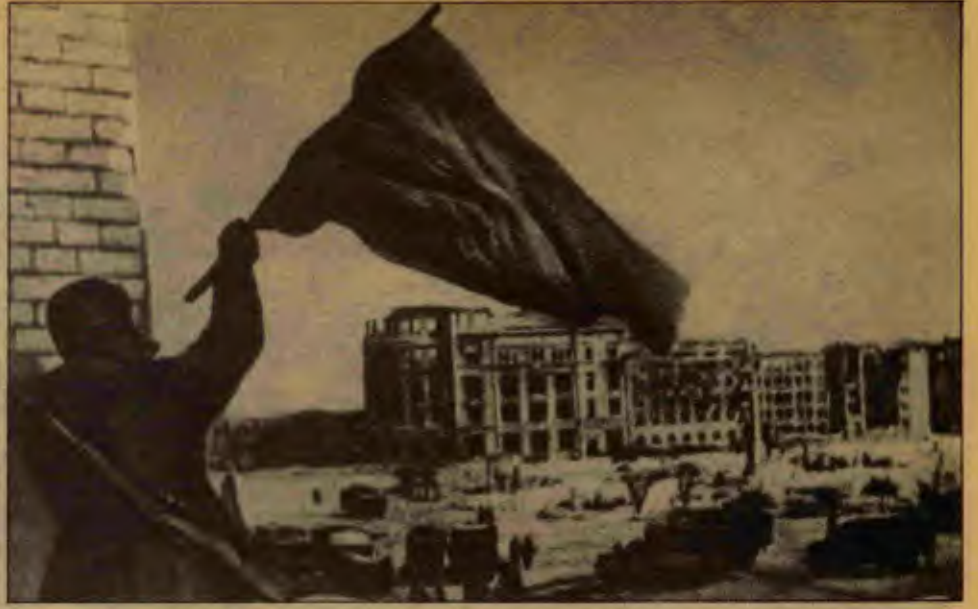
Sovyet bayrağı, 1943 Şubatı'nda, Stalingrad yıkıntıları üzerinde zaferle dalgalanıyordu

halkı Hitler ordularını şehre sokmadı. Şehir 1941'den 1944'e dek, 2,5 yıl abluka altında kaldı. Yiyeceği bitti, cephanesi tükendi ama teslim olmadı, kahramanlık destanları yarattı. 7-8 yaşında çocuklar bile örgütlendiler, yağın bombaları patlamadan toplamakla görevlendirildiler. Kışın donan Ladoga gölü üzerinden önceleri gizlice şehre yiyecek ve malzeme taşınyordu. Naziler durumu anlayınca, aynı iş bombardıman altında sürdürüldü.