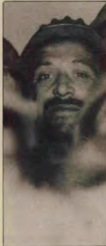
Halk sağlığı da kavga sorunudur