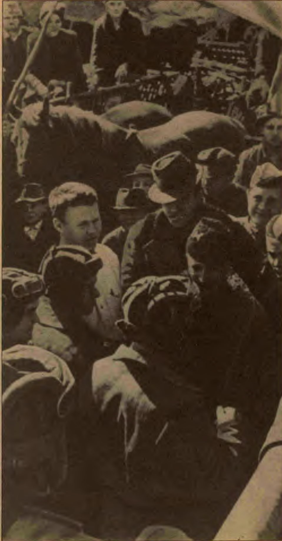
Yugoslav partizanları ve Sovyet askerleri işgalci Nazi ordularına karşı omuz omuza

Bu arada tüm Berlin'de savaş yürüyordu. Göbbels ve Borman, Sovyet ordularının komutanıyla görüşme istedi- ler. Görüşmeye gelen general, Hitler'in öldüğünü, yeni bir hükümetin işbaşında olduğunu bildirdi ve ateşkes istedi. Sovyetler, ancak Almanya teslim olursa ateşkesi kabul edebileceklerini belirttiler. General gitti ve ardından yeniden ateş başladı. Berlin 2 Mayıs'ta teslim alındı. 8 Mayıs'ta ise tüm Almanya teslim alındı. Sovyetler Birliği adına, teslim alma