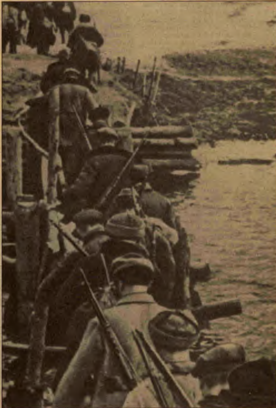
Şehirlerden köylerden Parti'nin çağrısına ayaklandı partizan

Almanya'nın bu ilhaki üzerine, Sovyetler Birliği Çekoslovakya'ya daha önce imzalanmış bir anlaşma gereği yardım önerdi. Ama Çekoslovak hükümeti ka-