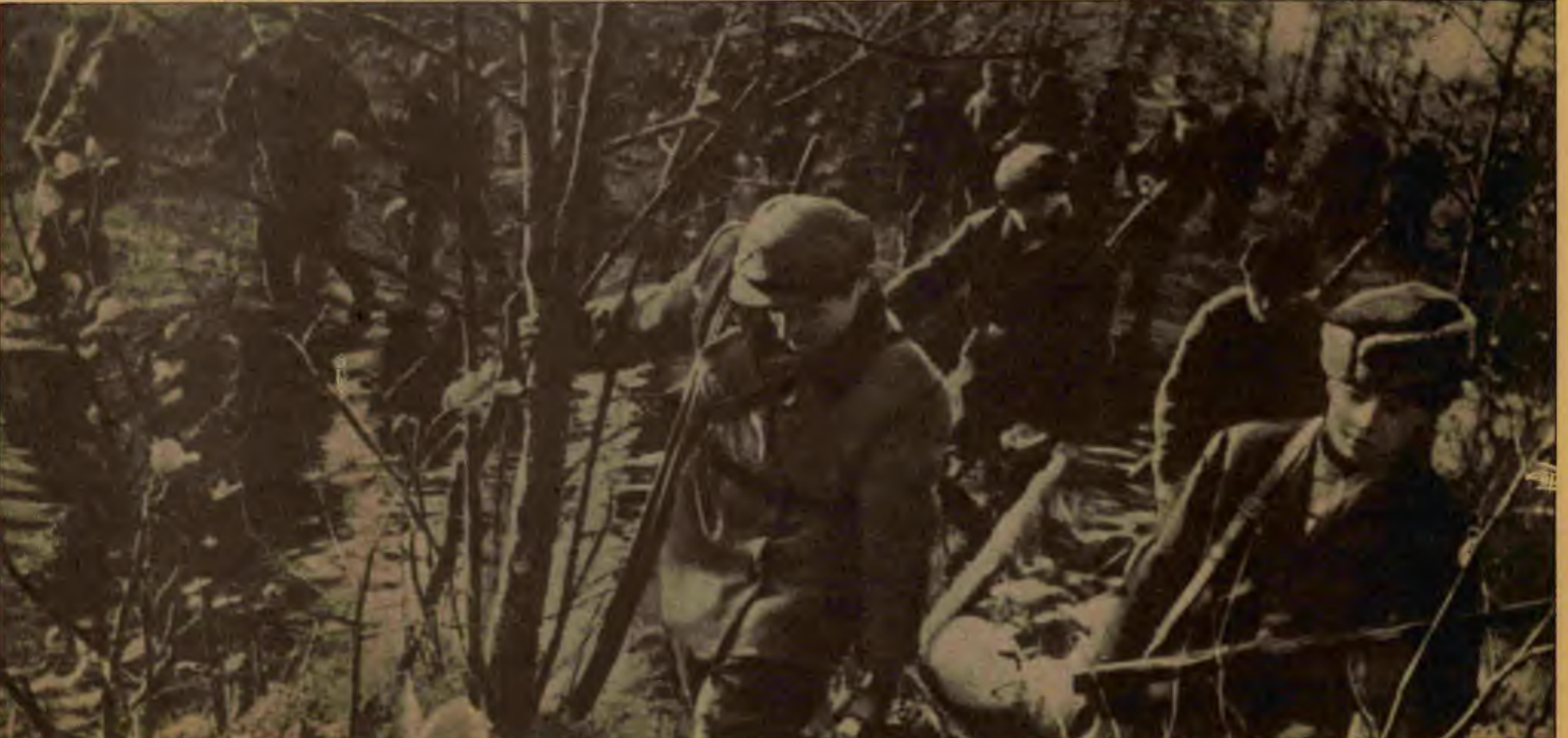
Partizanlar savaş boyunca, kırd kentte düşmana kan kusturdular. Cephe gerisinde Nazi ordularına, Gestapo'ya karşı kahramanlık destanları yarattılar

Sovyetler Birliği de zafer sarhoşluğuna hiç kapılmadan Berlin'e ciddi hazırlık yapıyordu. Zafer sarhoşluğu yoktu ama belli bir iç rahatlığı haklı olarak vardı. Savaşın başından beri yılbaşı ilk kez 1944-1945 gecesi kutlandı. Stalin, Moskova'daki Kızıl Ordu sorumlularının, Kremlin'e, savaş boyunca ilk kez dosyalarını almadan gelmelerini istedi. İç savaşın zaferinde büyük payı olmuş