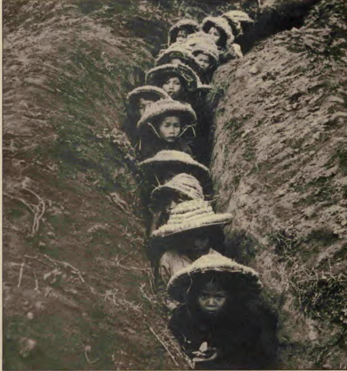
Ana babaları savaşan bu çocuklar, okula böyle gidiyorlardı.

kulenin bir maketi üstünde saldırı eğitimi yapıldı. 18 Mart 1948 gecesi eyleme geçildi. İki ekip, düşman takviyesini engellemek için mevzilendi. Yedi kişilik bir tim, köprüyü uçururken, üç