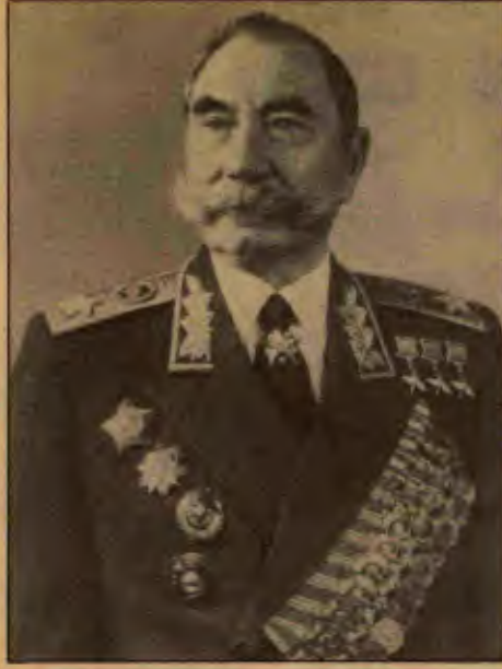
Mareşal Semyon Budyonni