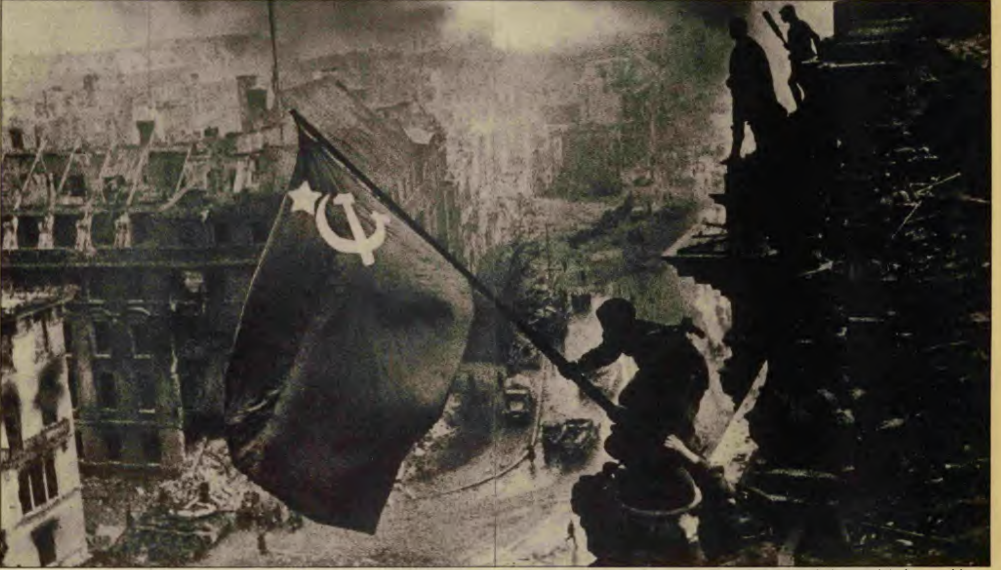
Kızıl bayrak, Reichstag'da dalgalanırken, Büyük Zafer'i simgeledi. Bu zafer, Sovyet halkının, SBKP öncülüğünde sonsuz özveri ve eşsiz kahramanlığıyla gerçekleşti.