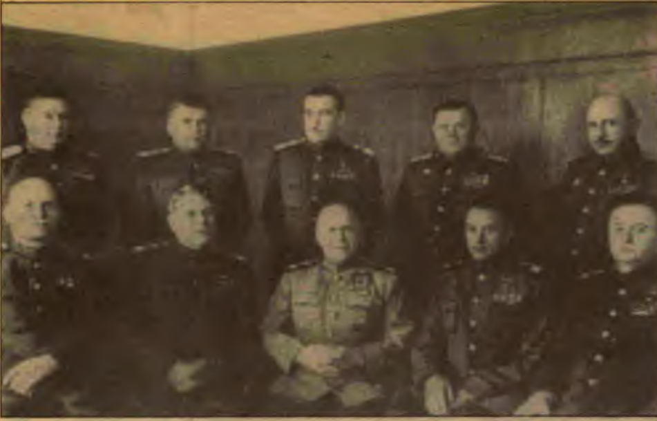
Aralarında Konev, Jukov ve Rokosovski gibi mareşalların bulunduğu bir grup komutan