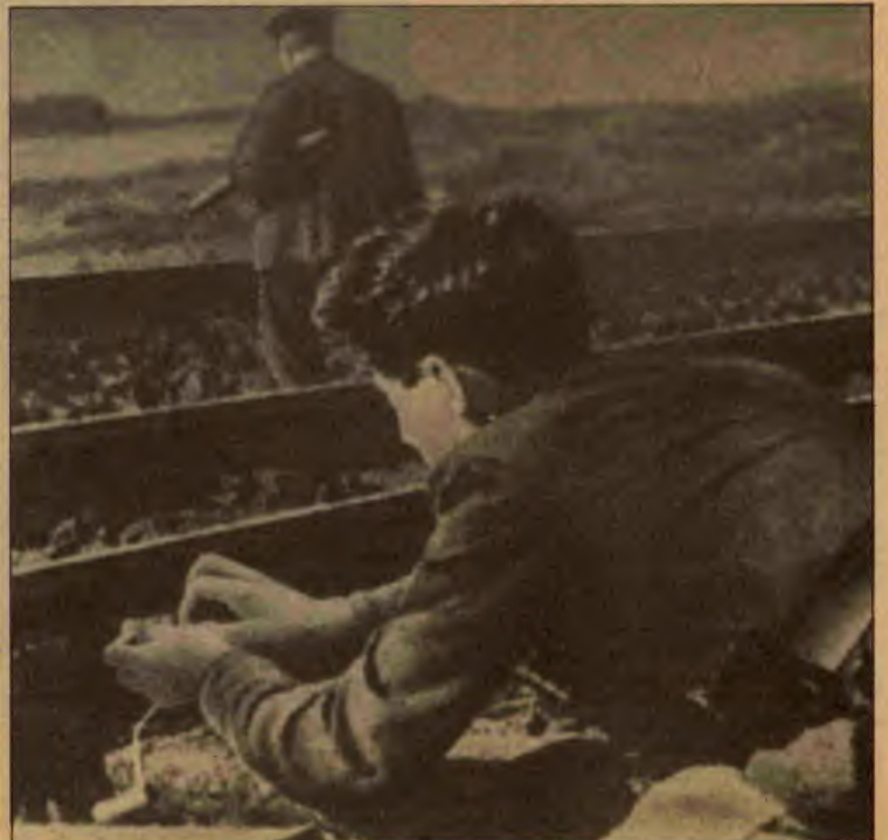
Düşmana karşı demiryoluna mayın yerleştiren genç bir partizan

Düşmanın Moskova'ya saldırısı püskürtüldü. Hitler orduları Leningrad'a da saldırıya geçmişler ve şehri ablukaya almışlardı. "Devrimin beşiğini faşistlere teslim etmeyiz" belgisiyle, Leningrad