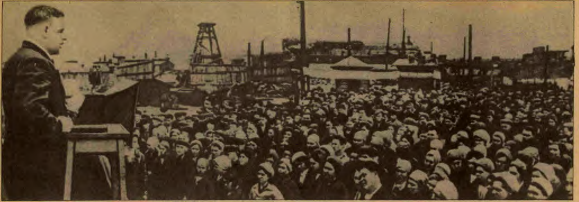
Sovyet işçileri düşmanı yenmek, biricik varlıkları olan sosyalizmin zaferini sağlamak için yemin ettiler. Proletaryanın bu kararlı, inançlı savaşımı, Sovyet topraklarını Nazi ordularına zindan etti.

Budyonni, bu savaşın da zafere doğru gitmesinin kıvancı içindeydi. İtalyan Komünist Partisi Genel Sekreteri Togliatti ve eşinin de katıldığı gecede, akordiyon çaldı, kalktı oynadı.