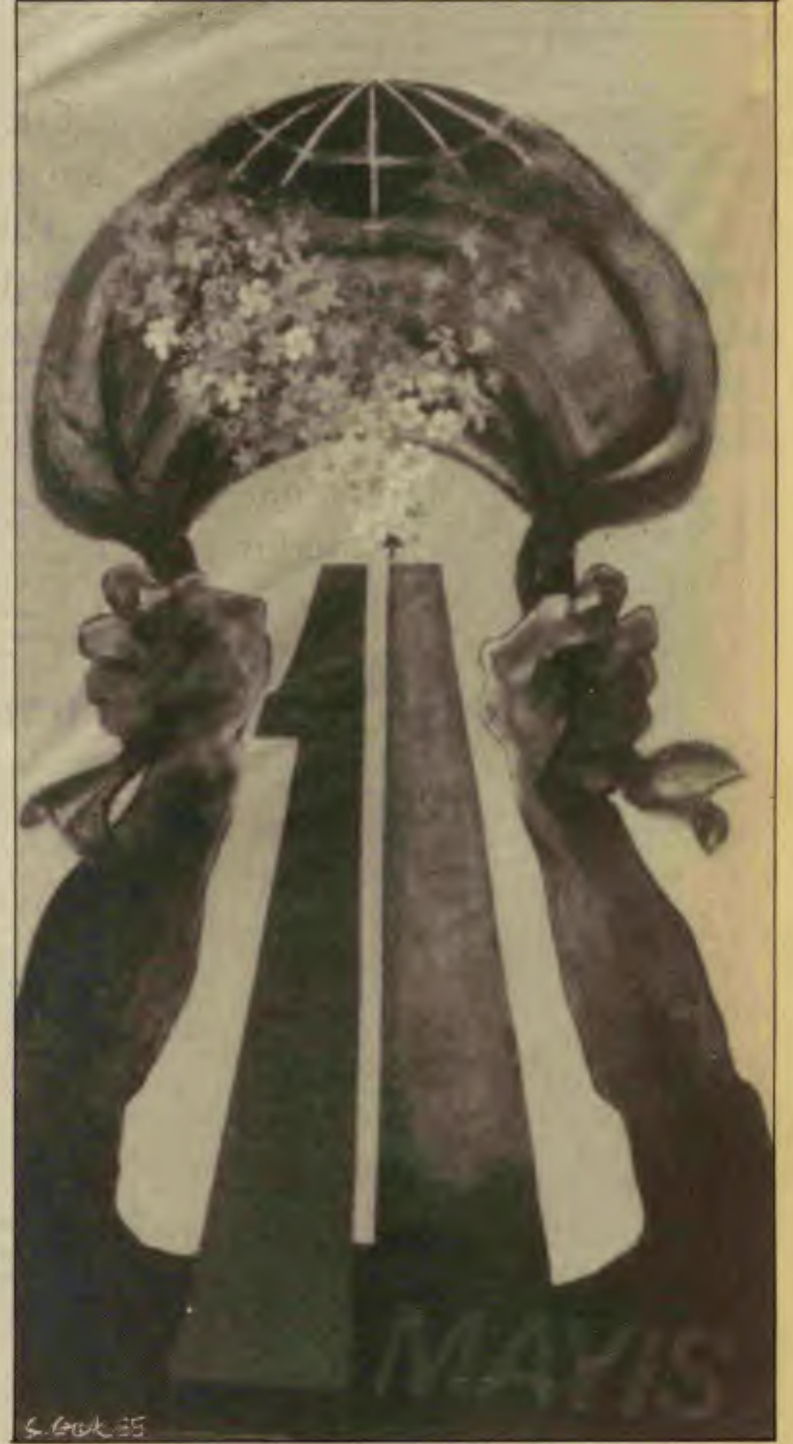
Öyle görünüyor ki, 1 Mayıs'ın da 100 yaşında olacağı gelecek 1 Mayıs'ı, Taksim'de 1 Mayıs alanında, kızıl sancaklarımızla türkülerimiz, marşlarımız, sıkılı yumruklarımızla kutlayacağız.

Kısacası işler kızışıyor. Küçük küçük eylemler ortalıkta dolu. Ama asıl önemlisi, örneğin hemen hemen tüm sendika yayınlarında, işçilerin, büyük eylemler yapma istemi açıkça yer alıyor. Öyle görünüyor ki, 1 Mayıs'ın da 100 yaşında olacağı gelecek 1 Mayıs'ı, Taksim'de 1 Mayıs alanında, kızıl sancaklarımızla türkülerimiz, marşlarımız, sıkılı yumruklarımızla kutlayacağız. Cemile Çakmak