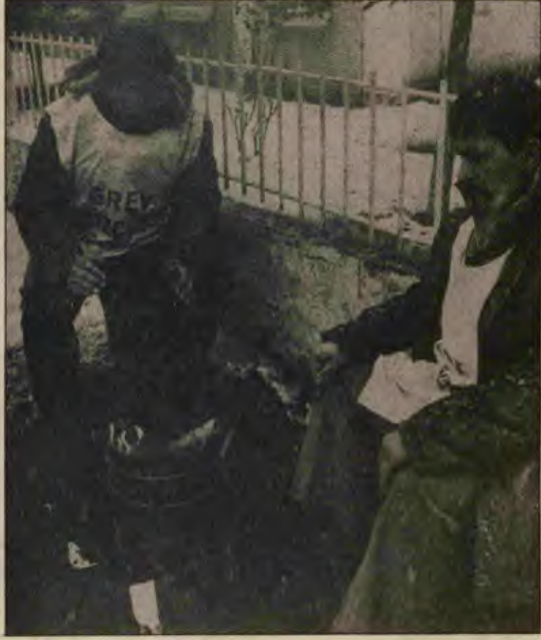
Domsan grevçileri karlar altında grev gözcülüğü yapıyor. Grev çadırını bile yasaklayan yasaların, ayaklar altında çiğnenmekten başka bir kaderi yoktur.

"Son birkaç yıldır yasalarda, tüzüklerde, yönetmeliklerde yer almış kazanılmış birçok hakkımızın ya tamamen ortadan kaldırıldığını