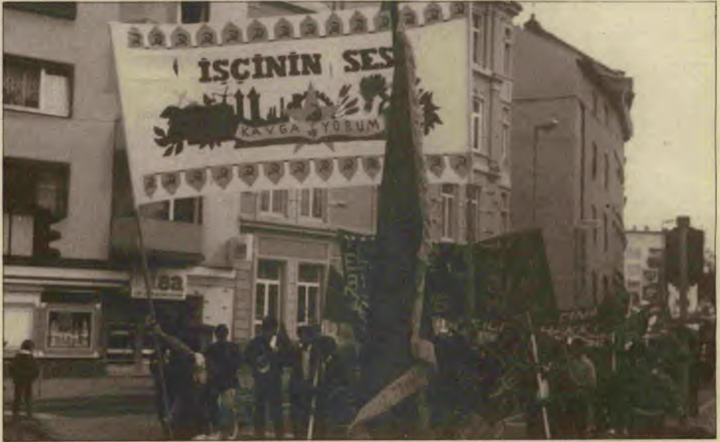
Frankfurt'ta İşçinin Sesi korteji