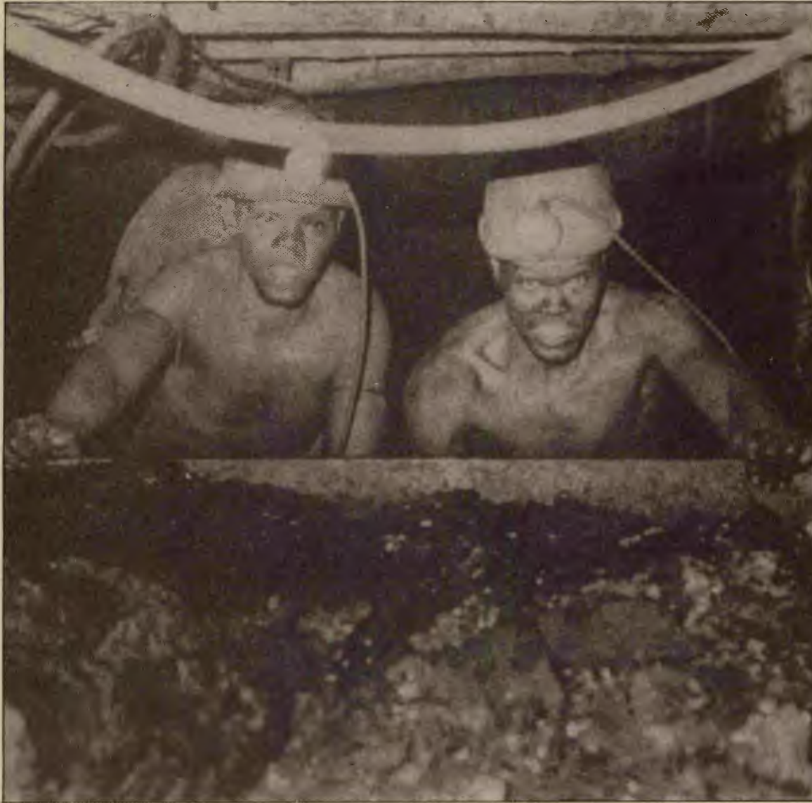
Güney Afrika işçi sınıfı, savaşımı yükselttikçe burjuvazinin vermek zorunda kaldığı ödünlere, yumuşatma siyasetine pabuç bırakmıyor. Devrimci çözüm için devrime hazırlanıyor.

Güney Afrika'nın komünistlerini, ANC'nin tüm savaşçıları yürekten, büyük bir kıvançla ve bu yolda giderlerse zaferlerine büyük bir inançla selamlıyoruz. Siz Afrika'nın o ucundan başlayın, biz de Türkiye'den arka çıkalım! Yaşasın Güney Afrika'da ayaklanma!