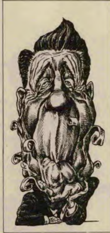
Reagan'ın teflonu böyle soyuluyor.

Avrupa Parlamentosu'nun 434 üyesinden 200'ü, Reagan'ı, kendisinin hiç beklemediği bir sertlikte protesto etmeye başlayınca