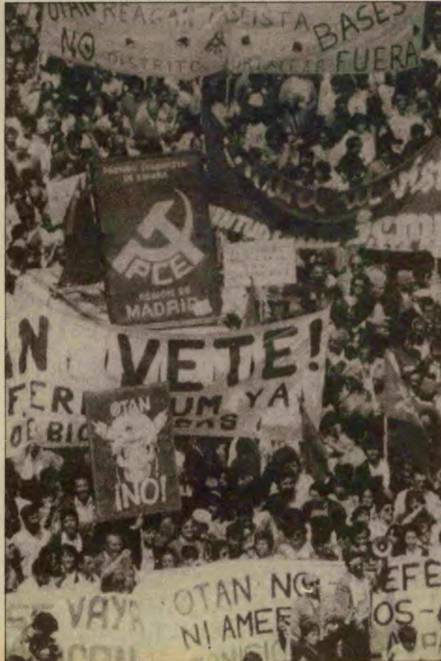
Madrid'te 500 binlik dev gösteri