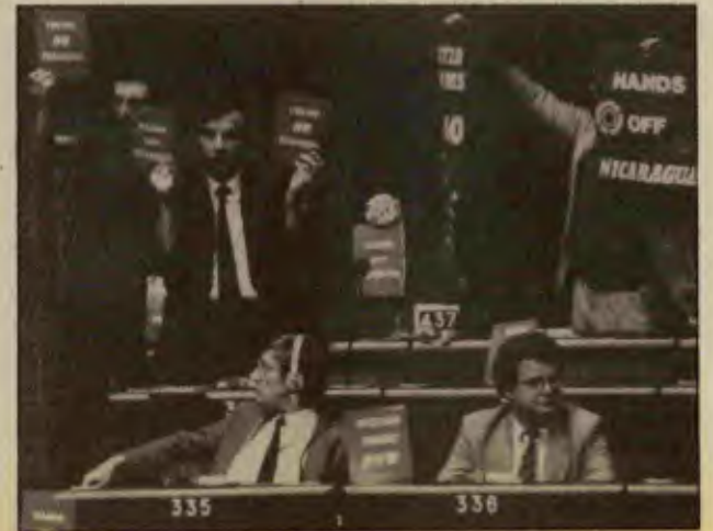
Reagan, Avrupa Parlamentosu'nda da protesto edildi