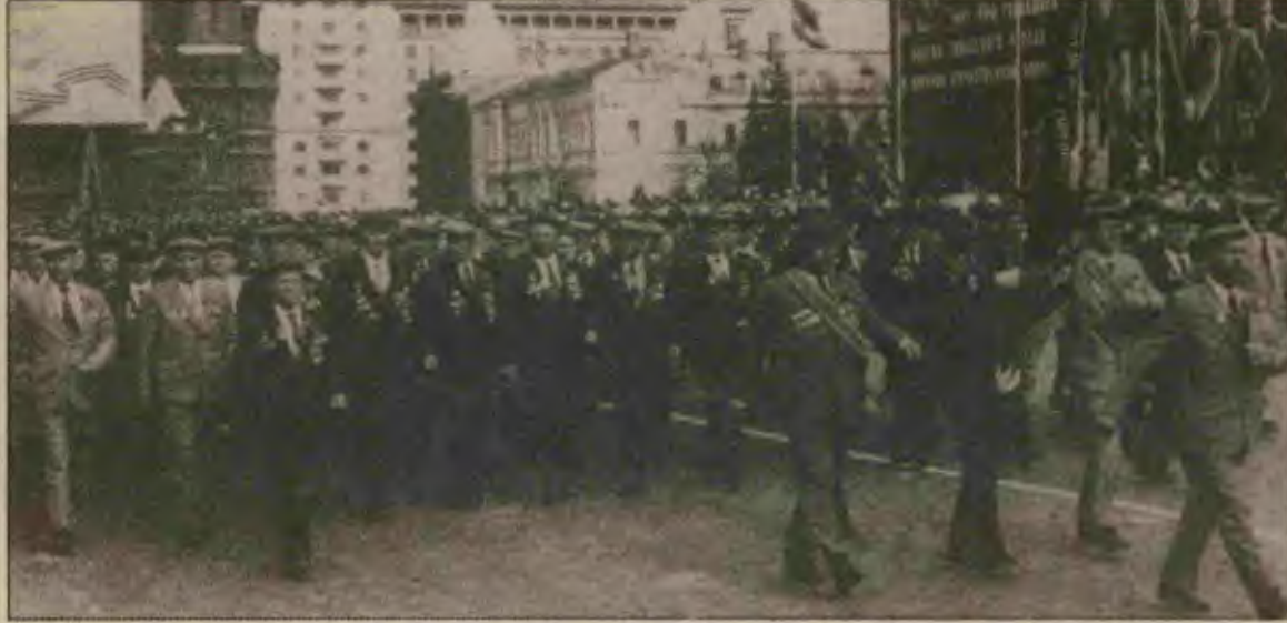
Kızıl Ordu ve Partizan gazileri Kızıl Meydan'daki törende halkın coşkun sevgi gösterileri eşliğinde gururla yürüyorlar.

Gorbaçov yoldaş konuşmasında, savaş sırasında öteki halkların kahramanlıklarına da değindi ve bunu yaparken Yugoslavya'dan haklı olarak, en ön sırada sözettii. Arnavutluk ve Doğu Avrupa halklarından sonra, Batı Avrupa'daki direniş