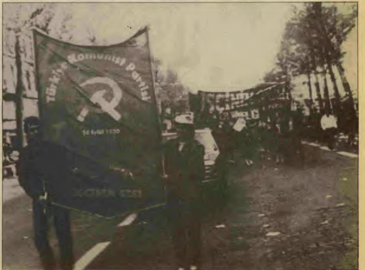
Paris'te CGT'nin düzenlediği yürüyüşte İşçinin Sesi korteji