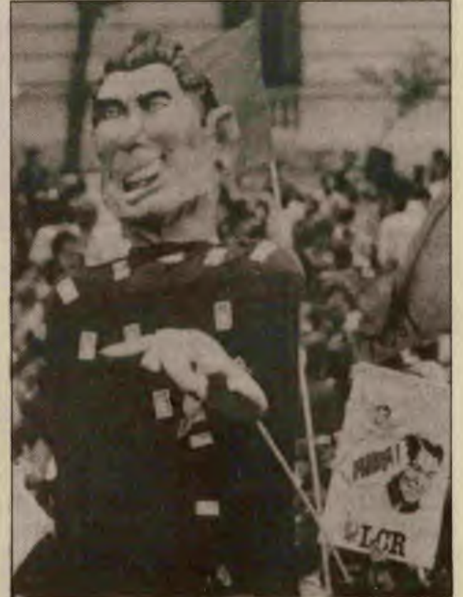
Reagan'ın kuklası biraz sonra yakılacak