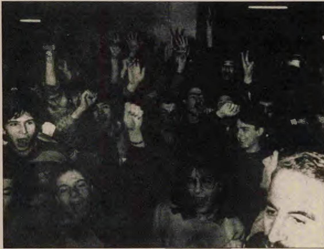
Hacettepe'de yükselen militan eylem tüm okullarda yankılanıyor.