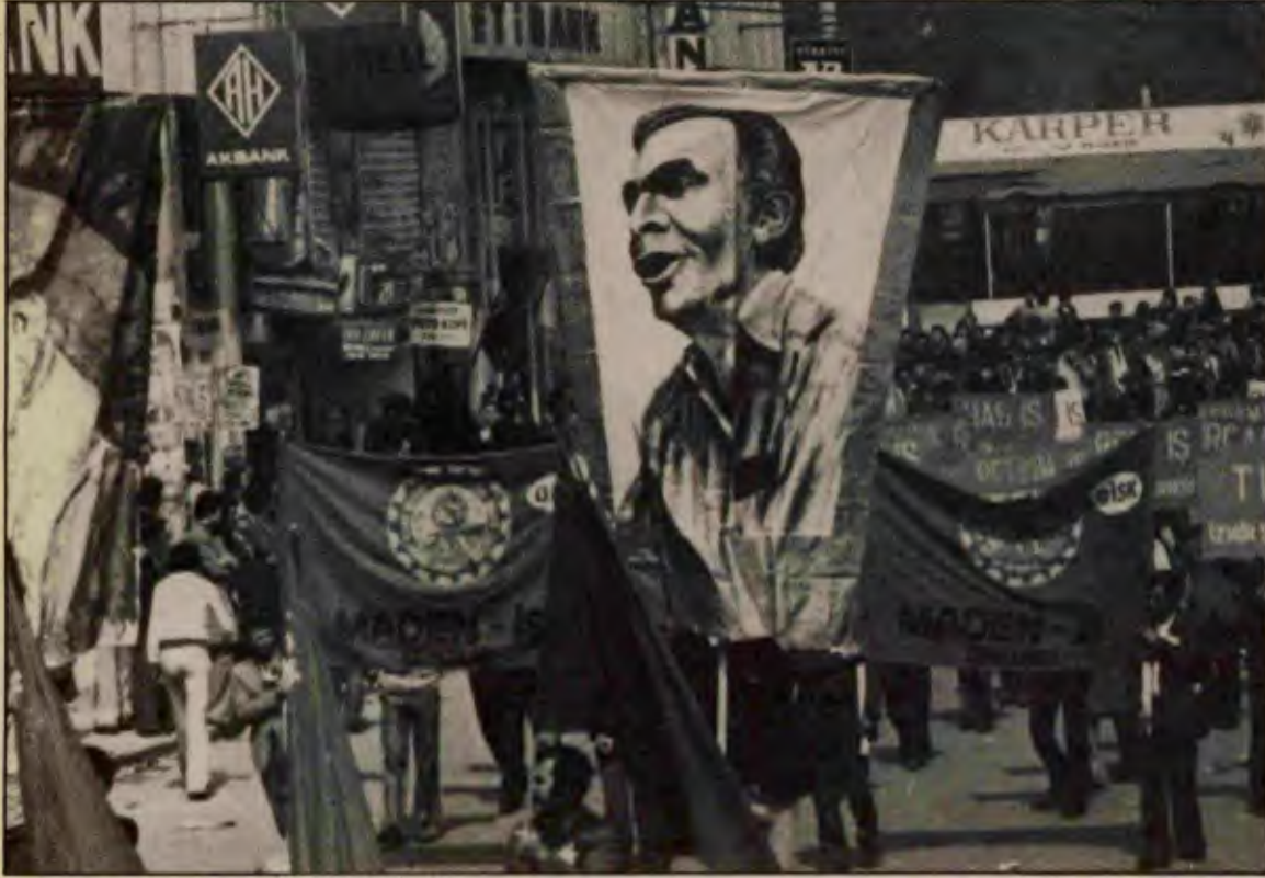
1 Mayıs 1976'nın 10. yıldönümünü kutlarken, heyecanla beklediği ilk açık yığnsal 1 Mayıs'ı göremeden aramızdan ayrılan

1 Mayıs 1976'da Türkiye işçi sınıfı dünya işçilerinin bir parçası olduğu bilinciyle, şanlı, militan, örgütlü, disiplinli ve gerçekten dev bir eylem koydu. 1 Mayıs'ı ilk kez açık ve yığnsal olarak kutladı. 1 Mayıs 1976'nın 10. yıldönümü tüm işçilere kutlu olsun! Aradan geçen 10 yıl içinde işçi sınıfımız deneyimini daha da zenginleştirdi. 1976'ları, 1977'leri de geride bırakacak nice 1 Mayısılara!