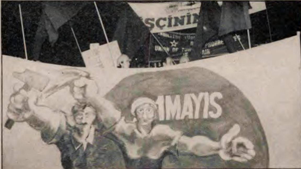
1 Mayıs'ta 1976 1 Mayıs'ının panosu taşındı.