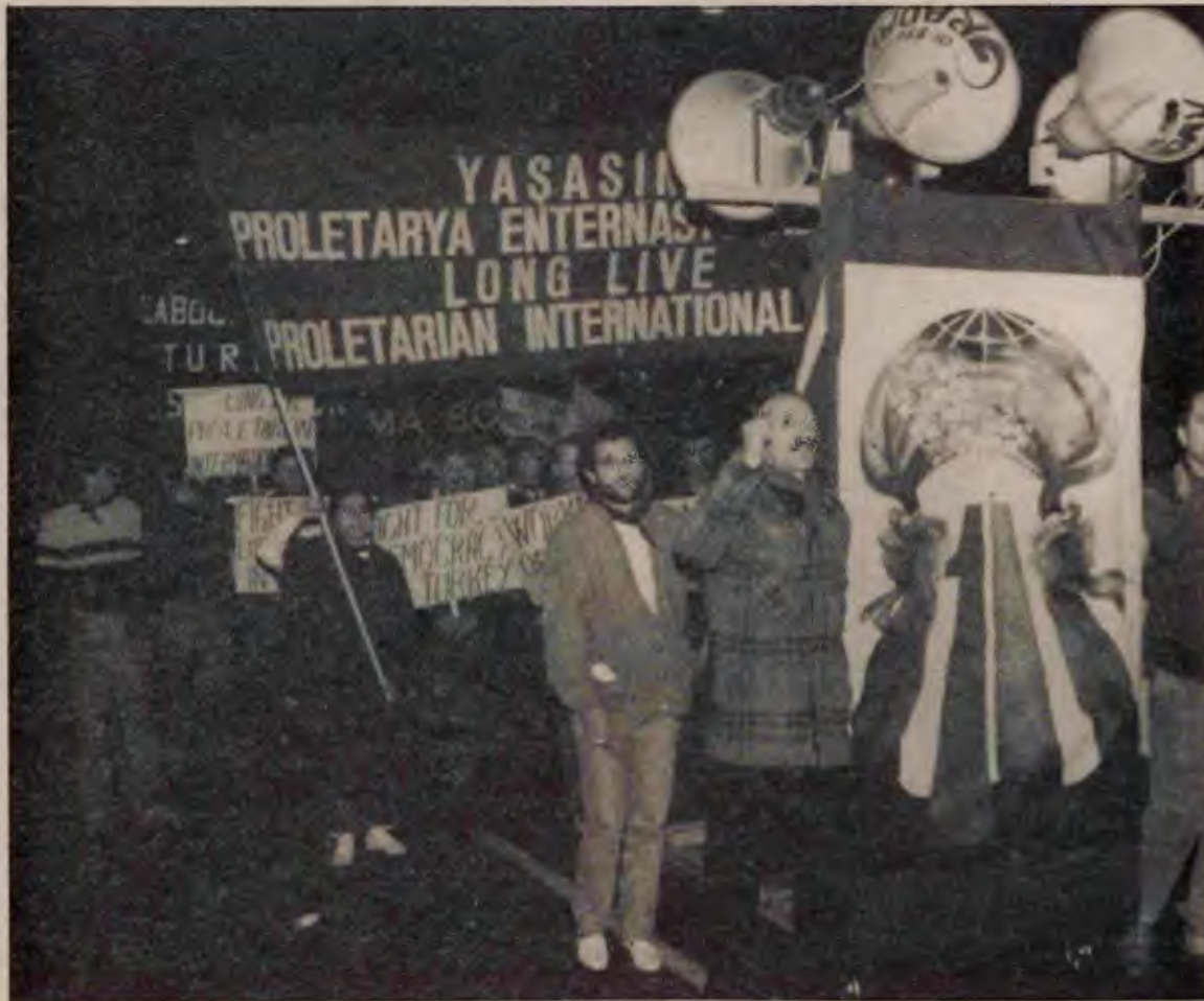
Yürüyüş kolumuz heyecanı, disiplini ve kızılıyla sevgi topladı.