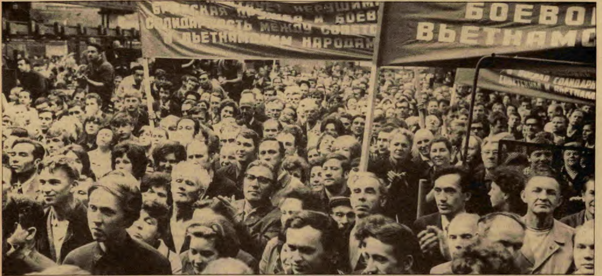
Yaşam bugün, dünya devriminin ilerletilmesi için, 1970'lerde Vietnam devrimine gösterilen duyarlılıktan çok daha fazlasını gerektiriyor.

resmi uluslararası siyaseti, dünya devrimi sorununu, dünyanın çeşitli bölgelerindeki özgül devrimleri ve savaşları, kendi barış savaşımına açıkça bağımlı kılıyor. Bu yaklaşım, devrime yol açan çelişkileri, savaşları ve "sıcak noktaları" ortadan kaldırma çağrısına kadar ilerletiliyor.