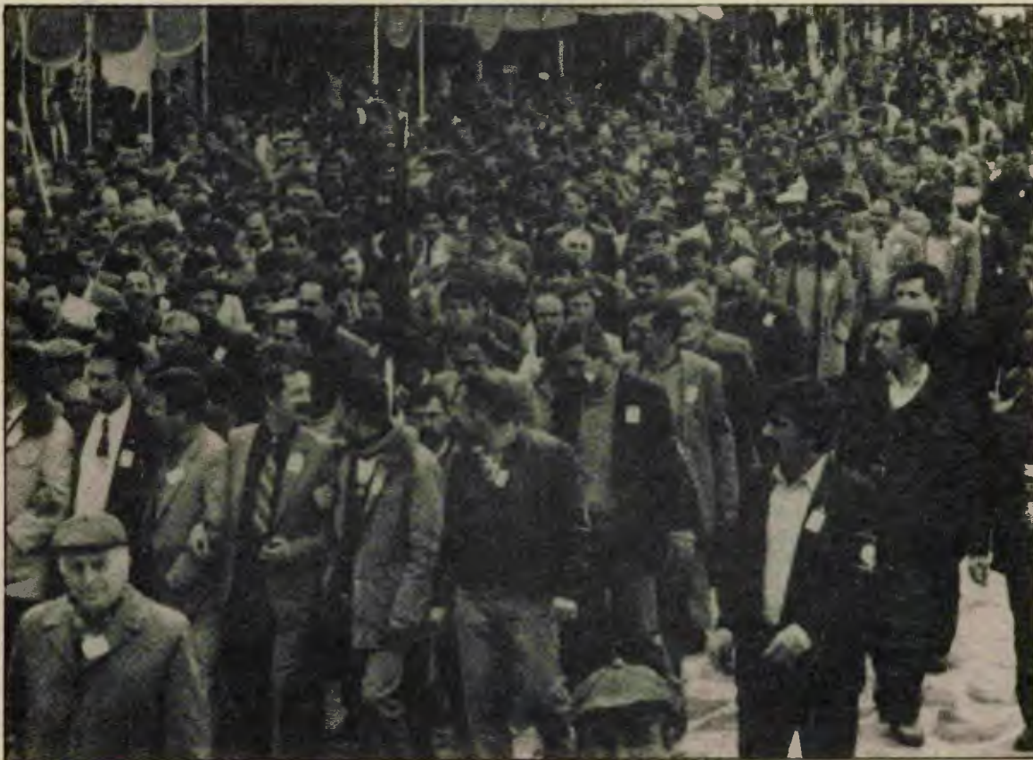
İşçi sınıfı yalnızca yolsuzluk yapanlardan değil, faşistinden burjuvaziye kendine kan kusturanların tümünden hesap soracaktır. Hem de Arjantin usulü uyuz mahkemelerle değil kıpkızıl bir devrimle.

"Hiç kimse bu dönemin savunmasını yapmaya kalkmasın, anarşi ve terörü gerekçe saymasın. Mustafa Kemal Paşa; İngilizlere, Yunanlılara, Çerkes Ethem'e, Anzavur'a, Hilafet ordusuna; özetle dış ve iç düşmana karşı ulusal varlığımızın