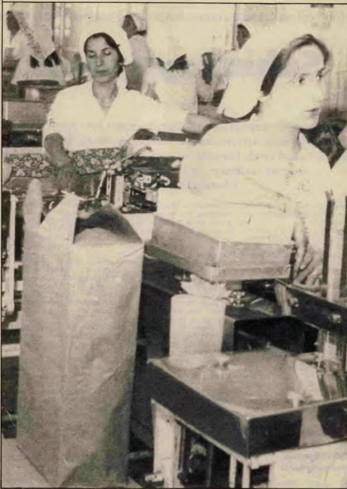
Daha herşey yeni başladı. Yolsuzluklardan da, kapitalizmden de hesap sorulacak.

Şahinkaya olayı patladığında yapılan mal beyanını yeterli bulmayanlar gözlerini sırdas hesabına çevirdiler. Ortalığı bir sırdas hesap düşmanlığıdır aldı. Bütün kötülükler ondan bilindi. Sırdas hesabın kaldırılması istendi. Biz de sırdas hesabın kaldırılmasından yanayız ama bunun kapitalizm altında, hele hele Türkiye kapitalizmi altında çok fazla bir değişiklik getirmeyeceği kanısındayız. Yılmaz Çe-