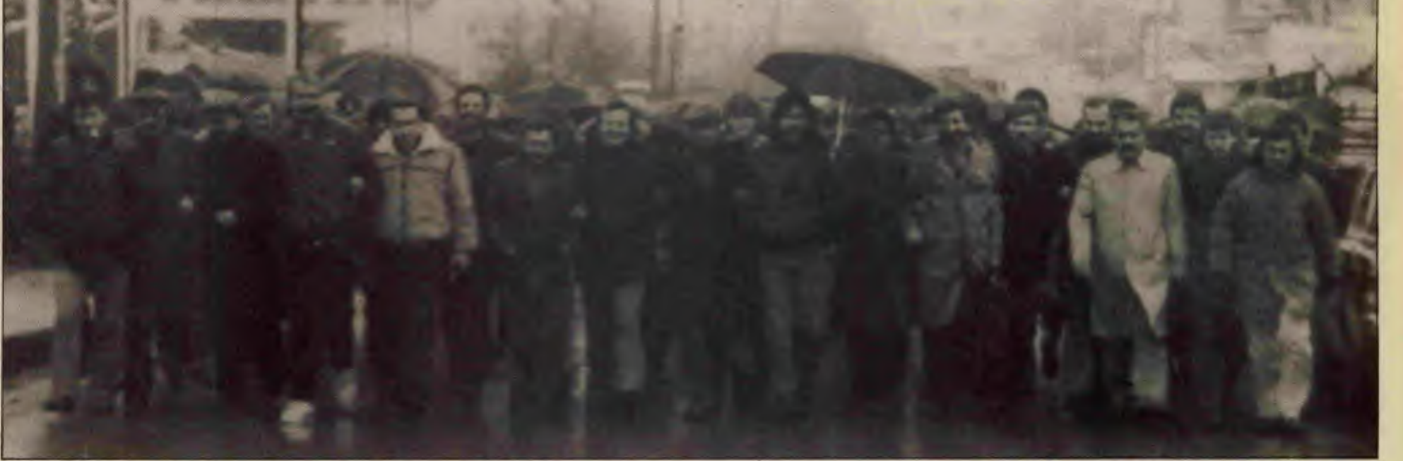
Netaş grevi savaşımı bir üst düzeye çıkardı

Yiğit Netaş işçilerinin grevi tam üç ay, büyük bir özveri, disiplin, coşku ve kararlılıkla sürdükten sonra, geçtiğimiz hafta sonuçlandı. Grev sonuçlandı ama Derby ile birlikte bu grevin işçi hareketini ulaştırdığı bir üst düzeyde savaşım olanca hızıyla sürüyor. Ülkenin dört bir yanında grev rüzgarları esiyor, kavga havası ve sınıf dayanışması yükseliyor.