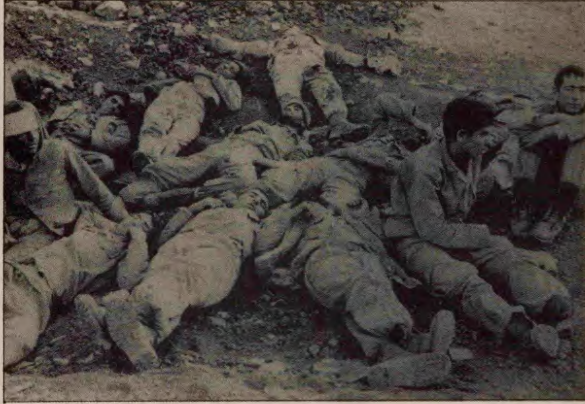
Sesi, sayı 264, Çek-Al)

"3. Savaş siyasal bir organın (devlet) siyasal amaçlar için kullandığı bir araç olduğundan, 'siyasetin başka araçlarla devamıdır' (İşçinin