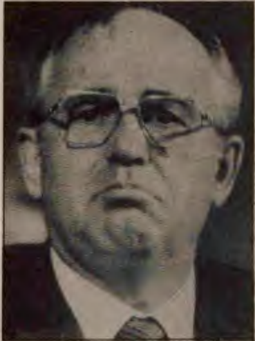
SBKP Genel Sekreteri M. Gorbaçov

Savaşın artık siyasetin başka araçlarla devamı olmadığını, savunular, Gorbaçov yoldaş da dahil, savaşın artık bir şiddet eylemi olmadığını, veya bu aracın artık devletlerce kullanılmama götürür. Dolayısıyla, nükleer savaş, savaşın ana amacını yerine getiremediğinden, "savaş, artık siyasetin başka araçlarla sürdürülmesi değildir". "Yeni" öne sürülen tanımın Kongre raporundan farkı, yalnızca nükleer savaşları değil, tüm savaşları kapsıyor olmasıdır.