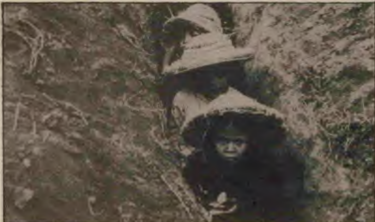
Özveri ve inançları ile dün devrimi başaran, bugün ayakta tutan Vietnam işçi sınıfı, Ho amcanın çocukları devrimin kazanımlarını sosyalizmi gözleri gibi koruyacaklardır.

Ekonomiye kısaca bakacak olursak görürüz ki Vietnam bugün dünyanın en yoksul ülkelerinden biridir. Kişi başına düşen ortalama yıllık gelir 160 dolardır. Ülkede son iki yılda enflasyon artış oranı yüzde 1000'dir. İşsizlik sürekli artıyor. Kamboçya'daki 140 bin kişilik ordu ise ekonomiye ciddi bir yüküdür. Sovyetler Birliği'nin büyük ölçekli ekonomik yardımı bile sorunların derinleşmesini önleyememektedir.