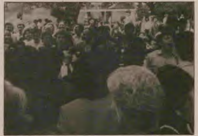
İki gün süren festival sırasında çeşitli yarışma ve turnuvalar düzenlendi.

Resmi TKP'de oportünizme karşı baş kaldırmış bir gurup yoldaşımız yazdı.