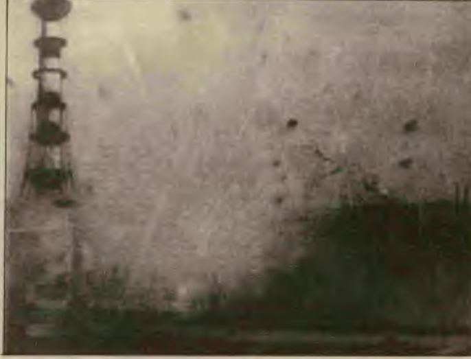
1986 yılında meydana gelen Çernobil radyoaktif patlaması milyonlarca insanın sağlığını tehlikeye attı. Buna rağmen Sovyetler Birliği kazayı üç gün dünya kamuoyundan sakladı. Sovyetler Birliği global sorunlarda kötü bir sınav verdi.

Çevre sorunları Gorbaçov yönetimince sınıflar-üstü olarak niteleniyor. Yeşilbarış örgütü, bu temelde dünya burjuvazisiyle işbirliği arayışı içinde kuruluyor. Böyle giderse, bu örgütün neyi yeşerteceği bellidir. Yeşilbarış örgütü, ancak sosyalizmin aktif yığın demokrasisi temelinde, hem Sovyetler'de, hem dünyada sosyalizme yaraşır bir işlev görebilir.