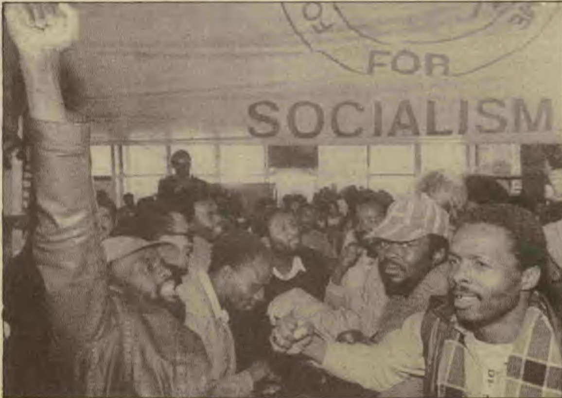
Güney Afrika'da işçi sınıfı, siyah halk yığınları ırkçı-emperyalist rejime karşı keskin bir devrimci kavga veriyor. Siyah işçiler, ağır baskı ve terör koşullarına rağmen ekonomiyi kökünden sarsan militan grevlerle rejime saldırıyorlar.

Türkiye de, Güney Afrika da emperyalizmin zayıf halkalarıdır. Türkiye'de devrimci dalga yine geliyor. Güney Afrika'da işçi sınıfı, siyah halk ırkçı-emperyalist rejime karşı keskin bir devrimci kavga veriyor. İki ülkede de burjuvazi zor durumdadır. İki ülke burjuvazisi bu zorluk karşısında "dayanışma" içine girmeye çalışıyor. Türkiye ve Güney Afrika işçileri, komünistleri olarak bizler de iki gerici rejime karşı sınıf savaşımını proleter enternasyonalist dayanışma içinde yükseltmeliyiz. Türkiye burjuvazisine de, Güney Afrika burjuvazisine de dünyayı zindan etmeliyiz.