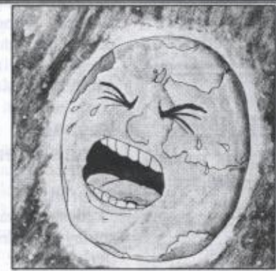
Dünyanın yüzünü güldüreceğiz.

Zorlu kavgaya zorlu hazırlanalım, burjuvaziye gerektiği cevabı verelim. 1998 kavganın daha da yükseldiği yıl olacaktır. ●