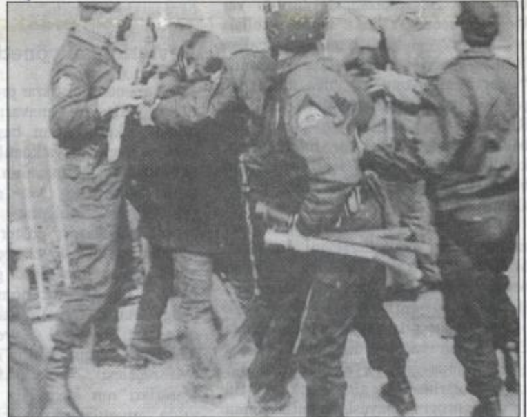
Öğrencilere saldırılar geri teperek

Bu koşullar altında devrimci savaşım bayrağını yüksekte