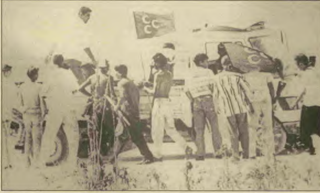
Çiller tarafından gönderilen faşistleri, Denktaş, törenle karşıladı

lendi. Uzi silahı-Çatlı-TİT- faili meçhul bombalama ve cinayetler, Susurluk bağlantılarını gözümüzün önüne getiriyor. Yine 1994 yılında Güney Kıbrıs'ta Kıbrıs Kürdistan'la Dayanışma Komitesi'nin başkanı olan bir ilerici Rum, faili meçhul cinayete kur-