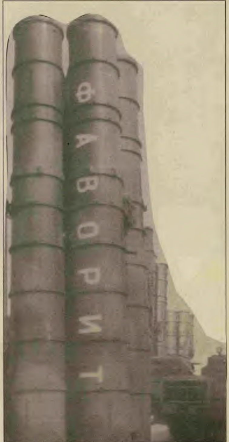
şöyledir: Bknz. Tablo I KKTC uyruklularda durum

Bunların yanında Kıbrıs'ın bütününe çok ciddi doğal bir sorunu vardır. Su sorunu. Gelecek yılların olası en önemli savaş nedenlerinden birisi olabilecek suyu KKTC Türkiye'den sağlama aşamasındadır. Konu ile ilgili ciddi çalışmalar yapıldı ve yakın gelecekte KKTC Akdeniz'in altından geçirilecek su boruları ile su sorununu TC'ye bağımlı olarak