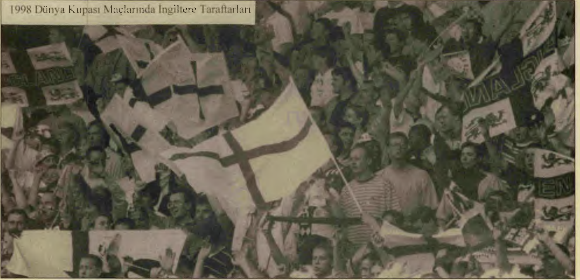
1998 Dünya Kupası Maçlarında İngiltere Taraftarları

■ İngiliz futbol serserilerinin maçlar boyunca gösterdikleri “yüzleri” Britanya devletinin belki de sonu anlamına gelecek “İngiliz milliyetçiliğinin” bir başka göstergesidir.